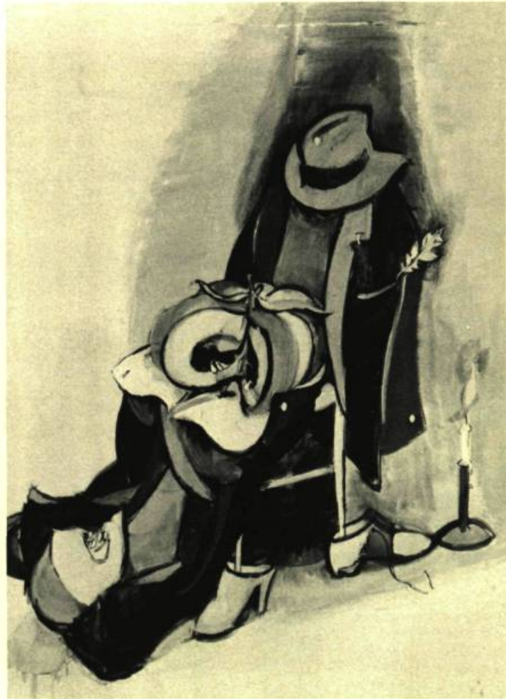
8. Jean HÉLION Exorcisme , 1976.

Malgré la récession, plusieurs nouvelles galeries se sont ouvertes à Londres alors que beaucoup de celles qui soutiennent les nouvelles expressions artistiques ont dû fermer ou déménager dans des locaux moins onéreux. En réalité, il y a à Londres cinq cent cinquante galeries — contre huit cents à New-York — et la ville soutient une importante collectivité artistique, des écoles d'art, des galeries et encourage des activités reliées à l'art. Pendant que les artistes éprouvent de plus en plus de difficultés à survivre financièrement, les maisons d'éditions d'art publient un nombre grandissant de manuels sur les arts utiles. De même, au Canada, le guide des arts visuels édité par Visual Arts Ontario s'est révélé très utile et a connu un succès considérable. En septembre 1981, les éditeurs anglais Angus et Robertson doivent faire paraître The Artists Hand-