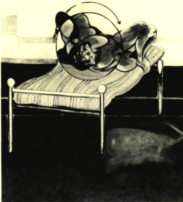
7. Francis BACON Three Studies of Figures in Beds

Depuis quelque temps, l'idée de patronage occupe beaucoup l'esprit des gens du monde anglais des arts. Le ministre des Arts dans le gouvernement conservateur, Norman Saint John Stevas, a prononcé plusieurs discours vibrants pour demander que l'on fournisse à l'industrie plus de moyens de parrainer les projets artistiques et de s'intéresser davantage aux arts. En fait, un organisme, établi par le Daily Telegraph sous le nom d'Association pour le Patronage des Arts par les Gens d'Affaires (Association of Business Sponsorship of the Arts), accorde des prix annuels aux compagnies qui ont accordé la meilleure aide aux manifestations artistiques. Il est possible que l'on soit surpris de ces témoignages d'appréciation à un moment où artistes et organismes d'art ont désespérément besoin d'aide. En Grande-Bretagne, les arts visuels sont particulièrement mal servis tandis que l'opéra, la musique et la littérature semblent plus chers au cœur du public. Comme presque partout, l'art contemporain, en particulier, est victime de l'attitude des hommes d'affaires qui répugnent à placer de l'argent dans un art qui est à la fois nouveau et inconnu.