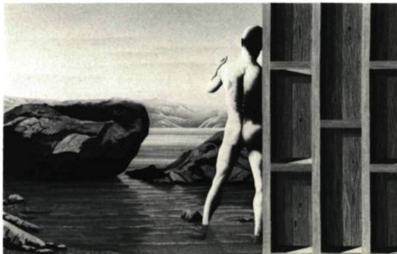
2. Le Baigneur . Huile sur toile; 60 cm x 99.