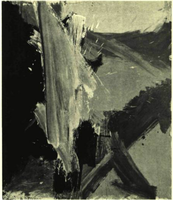
1. Au Festival International du Film sur l'Art d'Asolo, Willem de Kooning and the Unexpected (Erwin Leiser/Suisse).

documentaire exemplaire, à une exception près: jamais on ne verra l'artiste peindre à l'écran, tant il est rebelle à dévoiler son geste créateur.