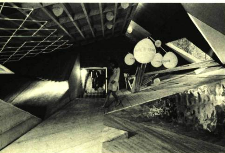
4. Pavillon de la France, Biennale de Venise 1970. Travail collectif; architecte: Claude Parent; miroir et graphisme, Bellaguet; escalier de Buri; plafond de Morellet; sculpture en bois de Mannoni.

espace tous les éléments pour monter et descendre. Ce que j'ai proposé a emballé les architectes, et, à partir de là, une collaboration très étroite s'est établie.