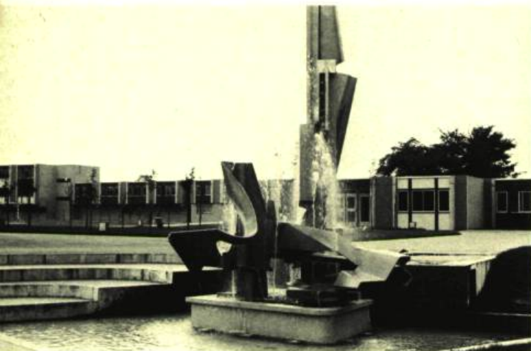
3. A Oberhoffen, en Alsace, Mannoni a conçu l'ensemble de cette place ainsi que la sculpture-fontaine.