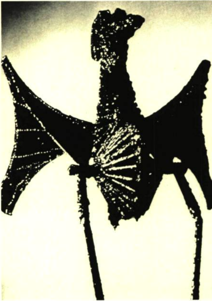
2. Clode PILOTTE L'Oiseau.

Cinq sculpteurs, cinq voies différentes par lesquelles ces artistes québécois nous invitent à découvrir les formes variées qu'ils animent et l'esprit secret et indomptable qui les a fait naître.