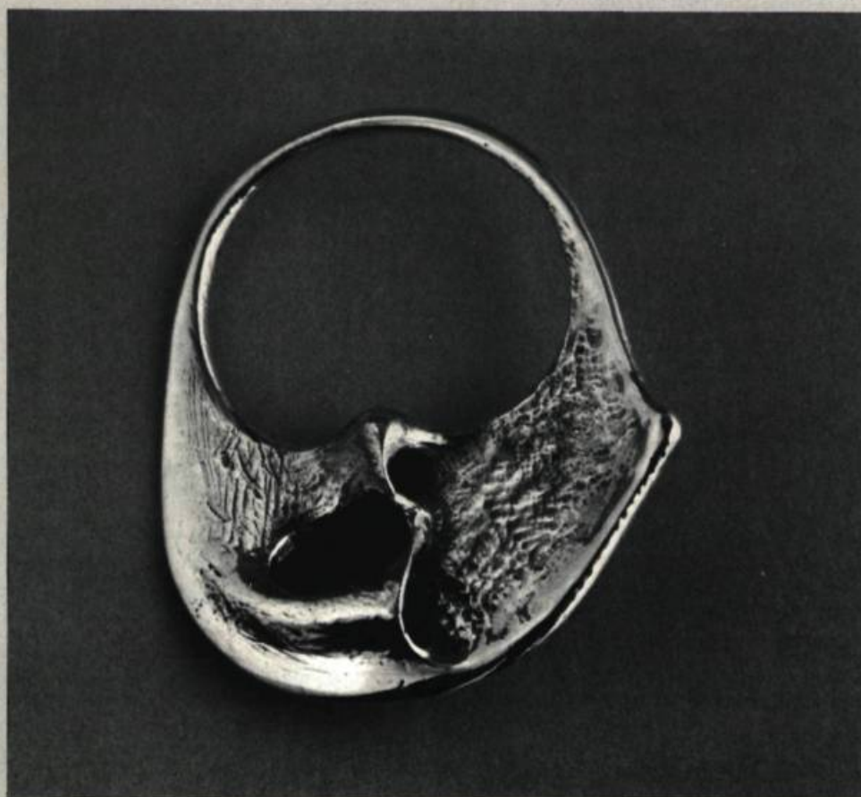
1. Jacques DIEUDONNÉ Sans titre.