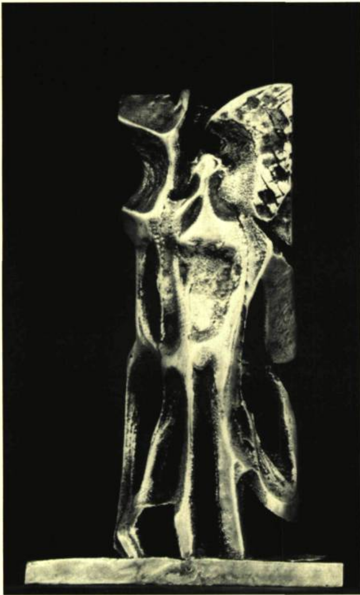
5. Pier GABRIEL Femme-matière.

s'apparentent beaucoup plus au bas-relief qu'elles ne procèdent à une exploitation systématique de l'espace. En 1978, l'artiste tenta de nouvelles expériences en incorporant aux métaux de la fibre de verre et des résines plastiques, dans le but de conférer à ses sculptures plus de légèreté et de luminosité. Cette expérience donna des résultats inespérés qui lui permettent de traduire, avec toute la subtilité possible, la sensibilité et l'authenticité qui sont au centre de son œuvre.