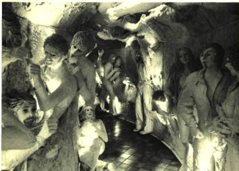
4. Francine LARIVÉE La Chambre nuptiale (détail).