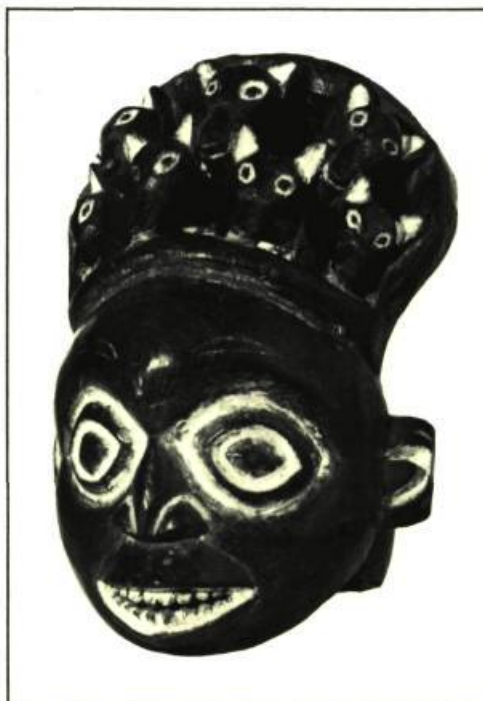
3. Masque heaume en bois. Haut.: 16 pces \frac{1}{4} ; Larg.: 12\frac{1}{2} ; Prof.: 12.

D'un point de vue strictement historique, il y a convergence entre ce moment où la civilisation européenne de la fin du 19 e siècle, délaissant la représentation naturaliste, se porte vers l'étude des couleurs et de la perception rétinienne (Impressionnisme, Nabis, École de Pont-Aven) et le moment où elle découvre l'arabesque japonaise, les formes simplifiées — expressionnistes et non naturalistes — de l'art primitif. Et ce n'est pas un hasard si, à la même époque, on commence à étudier les dessins des enfants et les productions des malades mentaux. Le seul, Gauguin fait le grand bond vers ces primitifs qui le fascinent. Arrivé aux Iles, c'est plus au mode de vie des indigènes qu'il s'intéresse qu'aux produits de leur art ancestral.