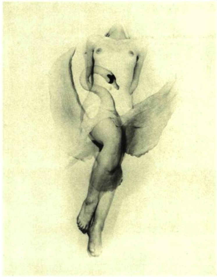
1. Pavane pour une infante défunte. Ravel. 1948.