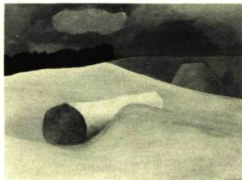
5. Stranded, 1972 . Huile sur panneau de bois; 51 cm. x 65.