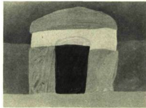
1. Toni ONLEY Foreground Blue , 1965. Acrylique sur panneau de bois; 51 cm. x 65.

dans l'œuvre, elle demeure une préoccupation primordiale.