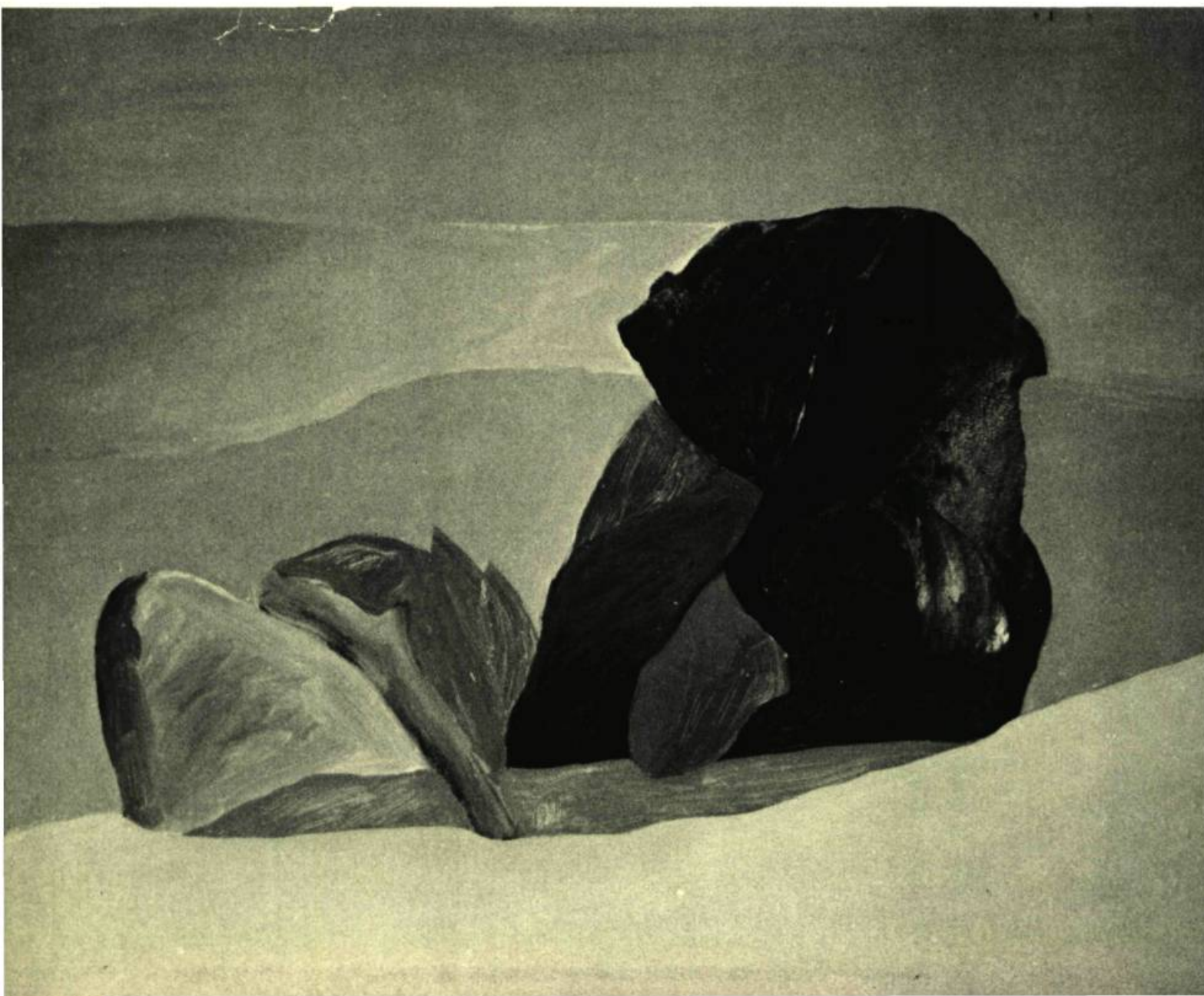
3. Oasis, 1969 . Acrylique sur panneau de bois; 51 cm. x 65.