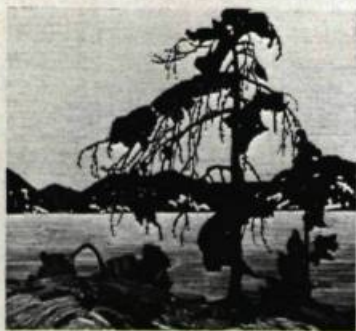
Canadian Landscape Painting, 1670-1930