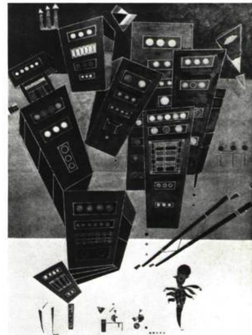
4. Vassily KANDINSKY Ténèbres , 1943. Neuilly-sur-Seine, Coll. Nina Kandinsky.