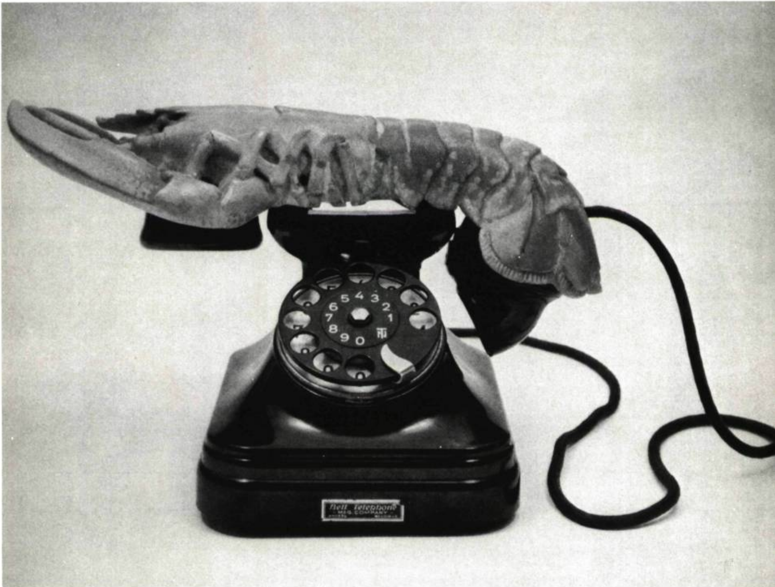
2. Pablo PICASSO Confidence. Paris, Musée National d'Art Moderne, Coll. Marie Cuttoli.