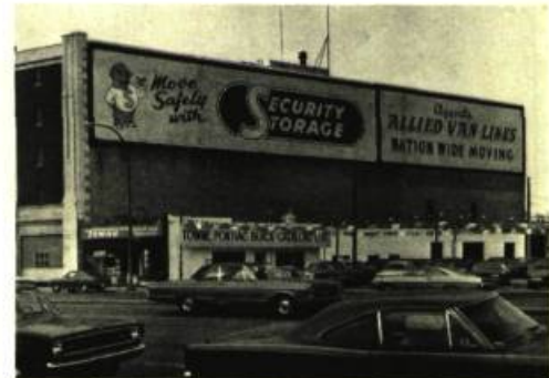
Bruce HEAD Hill Security Building, 725 Portage Ave., Winnipeg.