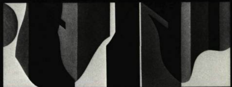
Duncan de KERGOMMEAU Projet pour le Slack Department Store, 181-185, rue Bank, Ottawa.