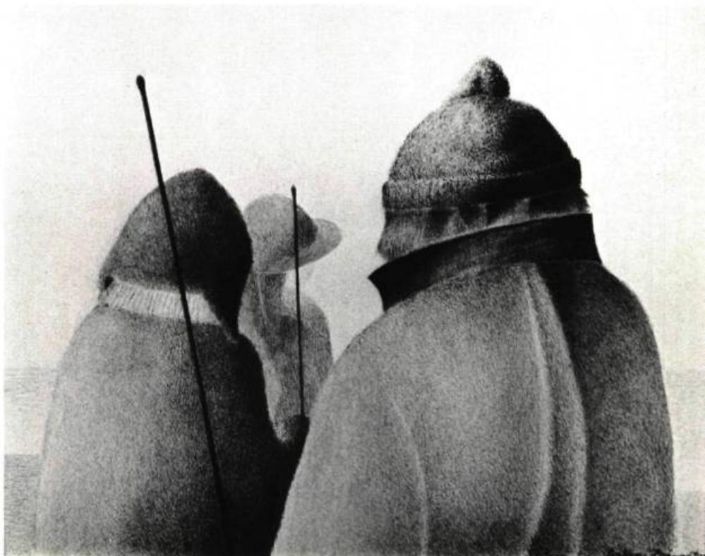
3. Le Bedeau , 1972. Aquarelle; 11 pces x 14. (27 x 35 cm.) Montréal, Coll. Robert Smythe.