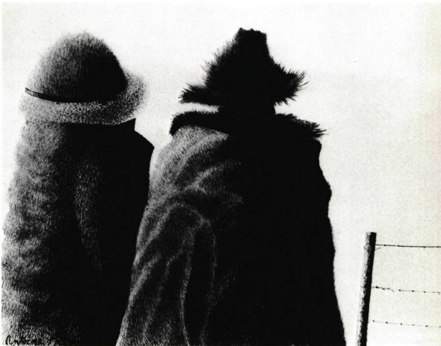
1. Les Notables , 1972. Aquarelle; 9 pces x 12. (22 x 30 cm.) Saint-Jean, Québec, Coll. Gilles Monast.