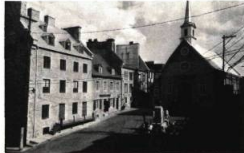
5. Les maisons Saint-Amant, Charest et Leber-Amyot.