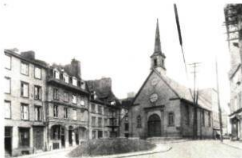
1. La place Royale d'après la maquette Duberger (1810)