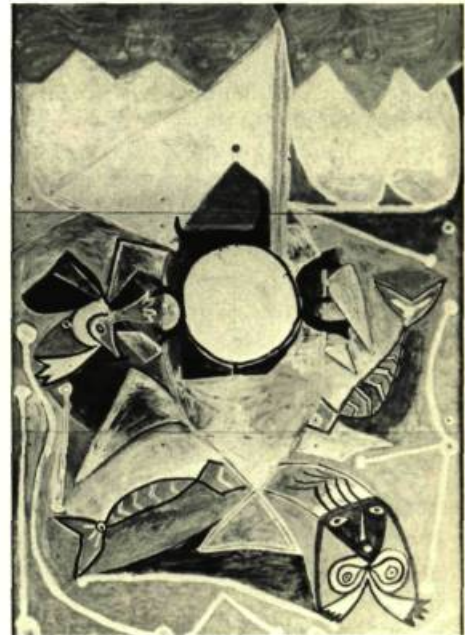
Ulysse et les Sirènes . Huile et ripolin sur panneau de fibro-ciment. 142 po. sur 98½ (360 x 250 cm.).

Porté par un élan dionysiaque, Picasso jette, pêle-mêle, centaures, ménades, femmes-fleurs, faunes, chèvres, près des rives marines qui les ont vu naître. Les dessins, comme écrits au fil du crayon, trait continu, sans bavure, multiplient les marques d'une plénitude de la chair qui exulte dans la liberté panique. La Joie de vivre dit un bonheur non contesté. Les divinités dont il se sert soulignent sa félicité amoureuse: Antibes est l'instant unique où il se fait comme un temps de repos dans la tension, quasi permanente, entre la violence et la mort qui forme la trame de l'œuvre de Picasso. Même les Maternités , nombreuses après la naissance de son fils Paulo, n'ont pas cette sérénité, cet abandon à la joie de l'heure, cette tendresse dans la volupté.