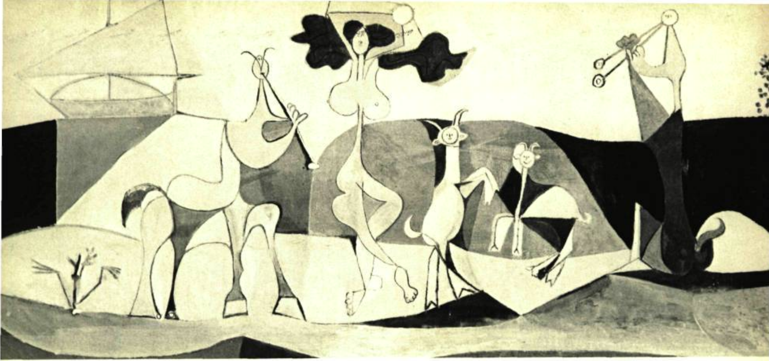
La joie de vivre Huile sur panneau de fibro-ciment (120 x 250 cm.)