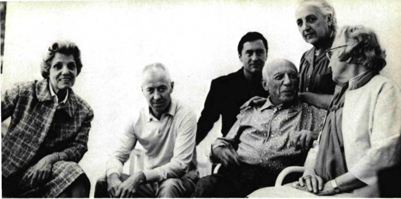
Picasso en conversation avec Mme Cuttoli; à gauche, Mme Suzanne Ramié, éditeur des poteries de Picasso, à Vallauris.