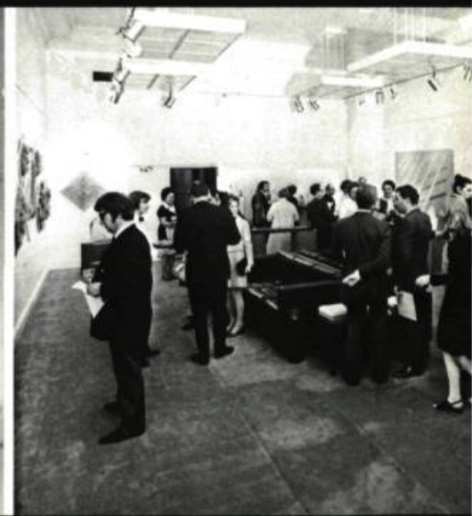
un soir de vernissage à la maison du canada, à londres.