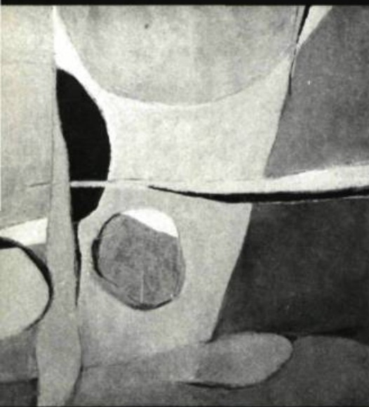
suraj sadan la nuit claire. huile sur toile; 24 po. sur 30 (61 x 76,25 cm.).

La simplicité absolue dans laquelle sont faites les expositions donne aux visiteurs la possibilité de découvrir l'art canadien dans une ambiance naturelle et contribue ainsi à faire rayonner "l'Image Culturelle du Canada" outre-frontière.