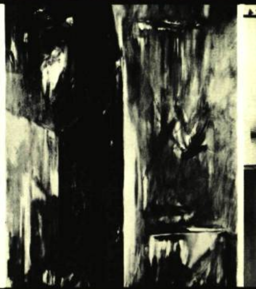
raymonde godin nuit de juin