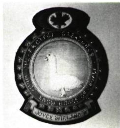
Joyce WIELAND. Exposition True Patriot Love. Snow Goose Crest. La Galerie Nationale du Canada, 1er juillet - 8 août.