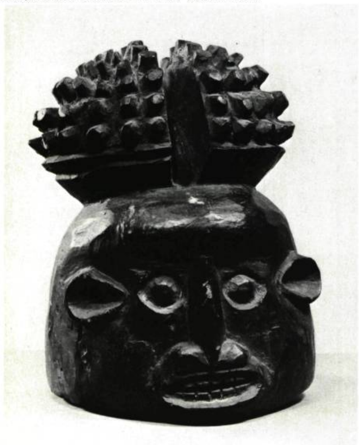
Exposition d'Art africain à la Galerie LIPPEL. Cameroun. Casque de tête BAMILEKE H: 12 po ½ (31.75 cm).