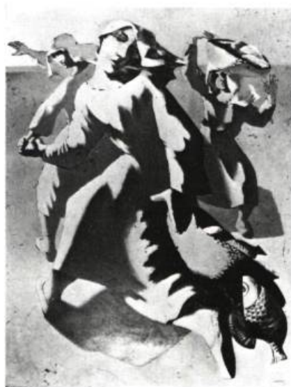
Léopold SURVAGE (1879-1968). La Peur des pêcheuses.