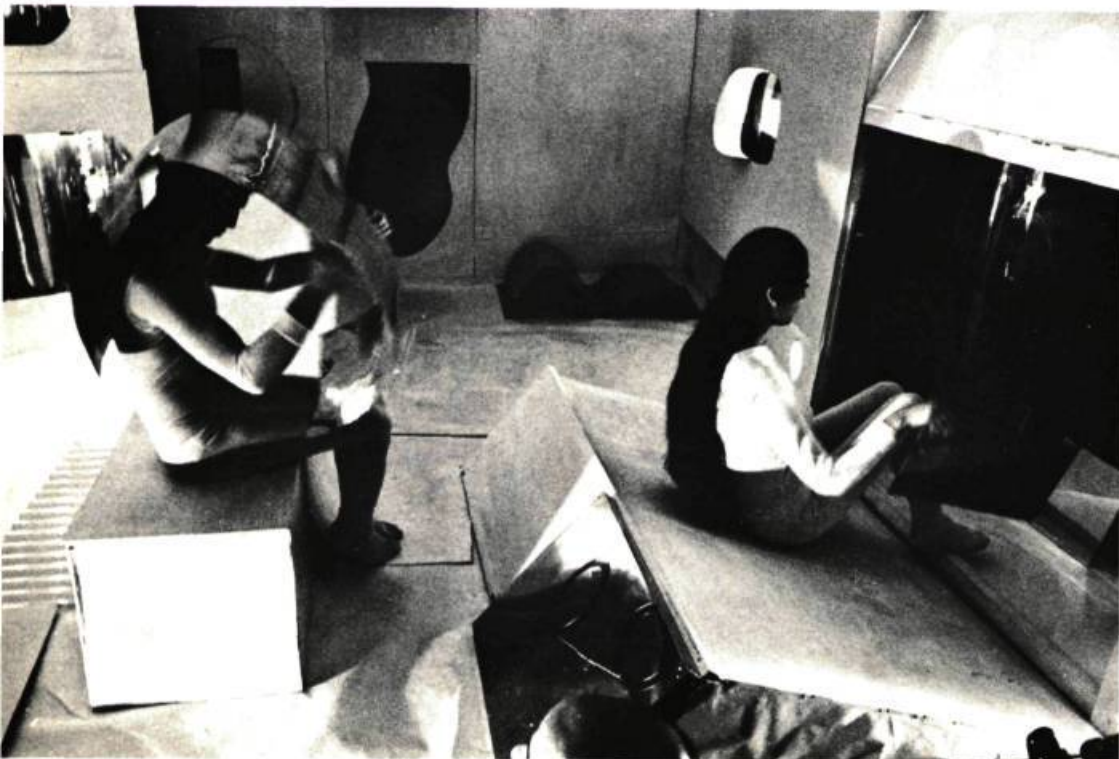
1. Le Groupe Cronus de l'Uruguay s'est mérité une mention. Ici, le mouvement humain fait partie intégrante de l'œuvre.