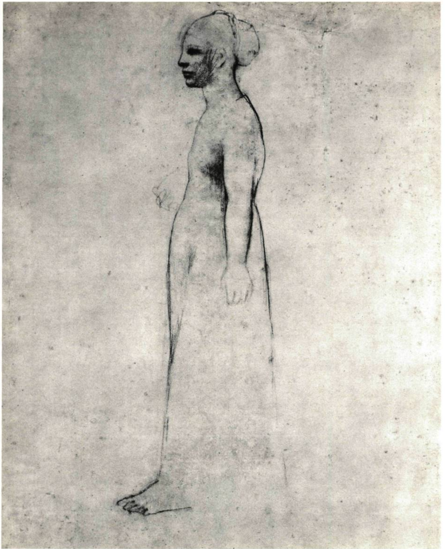
Pablo Picasso (1881- ). Jeune femme debout de profil. Craie noire; 23 po. \frac{1}{2} sur 17 \frac{3}{4} (59,5 x 45cm).