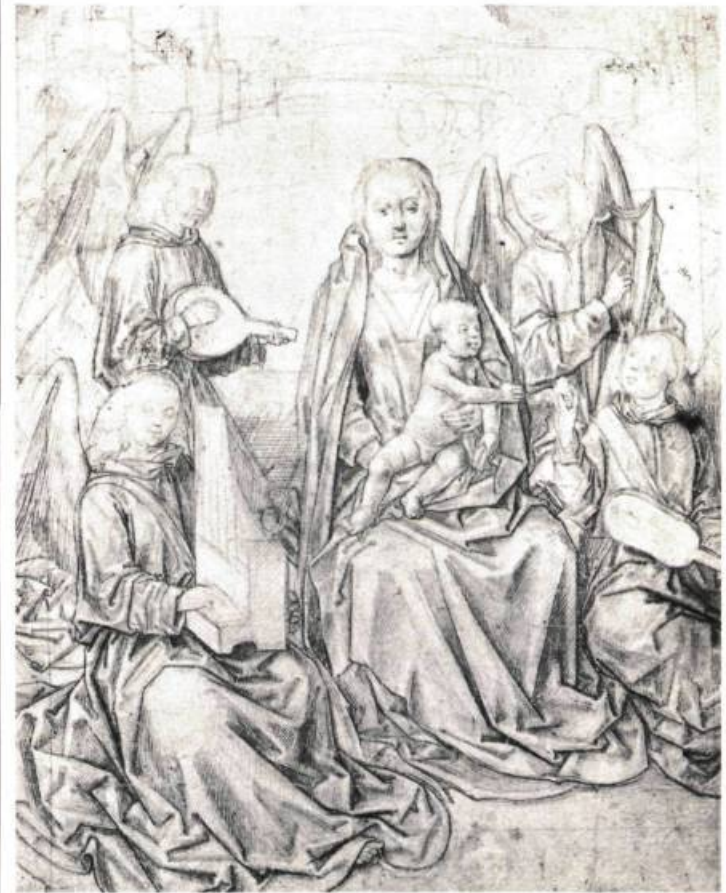
Attribué à Hans Memling ( -1494) La Vierge et l'Enfant Jésus entourés d'anges musiciens . Pointe d'argent sur fond crème; 9 pouces sur 7½ (25,4 x 19cm).