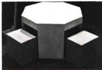
Table et quatre tabourets.