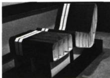
Un carton ondulé de \frac{1}{8} de pouce d'épaisseur a servi à fabriquer ce fauteuil et son ottoman. Le tout est livré sous la forme d'un emballage plat. Un type d'assemblage facile et résistant a été choisi pour permettre de le monter soi-même en peu de temps et éviter ainsi l'emploi de la colle ou de boulons et vis.