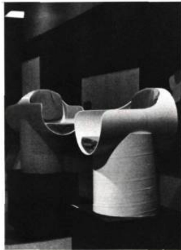
Fauteuils légers, extrêmement résistants dû à l'épaisseur déjà formée du carton. Conçu à partir d'un cylindre de carton par André Asselin.