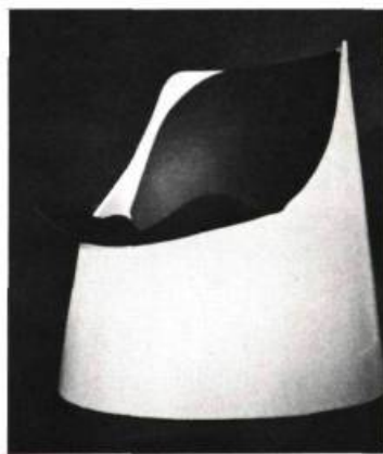
Ce fauteuil de carton est démontable et empilable. Conception simple : deux morceaux de cylindre s'emboîtent à l'intérieur d'un cône tronçonné.