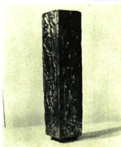
Vase de Bernard Chaudron.