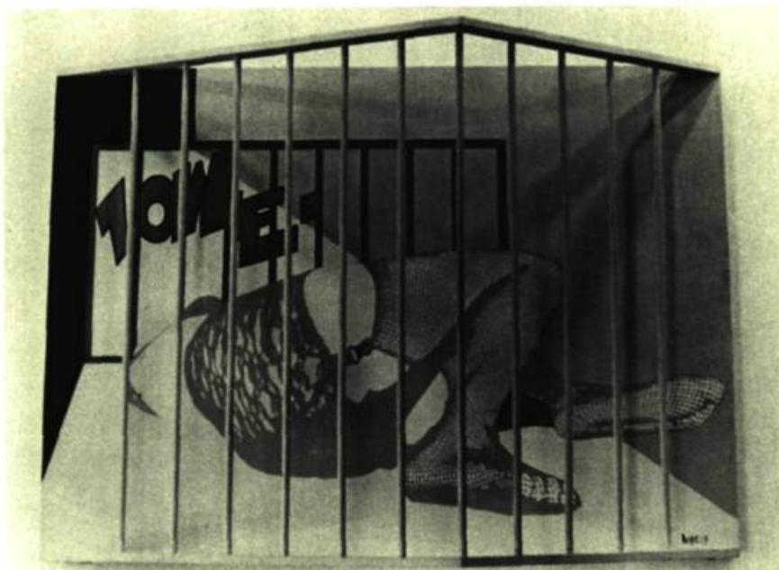
Ayot: Euphalie .

Dans le domaine de l'orfèvre, signalons l'exposition, à la Galerie des Artisans, de Bernard Chaudron. En 1965, il était bourgeois du Conseil des Arts, puis par la suite nommé à la Centrale d'Artisanat du Québec. M. Bernard Chaudron poursuit constamment des recherches de plus en plus poussées dans ce domaine et a mis au point des techniques qui semblent donner de très bons résultats. C'est du moins ce que l'on pouvait constater par les diverses pièces qui figuraient à son exposition. On remarquait, entre autres œuvres, une bague d'or au fini exceptionnel et à l'originalité remarquable; des colliers en cuivre dont la massivité ne détruisait pas l'élégance et le bon goût; des pots de fleurs en bronze et un calice, d'une grande simplicité de style. Mais ce qui sans contredit a surtout marqué cette exposition est assurément le tabernacle en bronze, coulé d'une seule pièce. Pour de tels travaux, M. Chaudron utilise la technique de la cire fondue, méthode artisanale très ancienne offrant aux artistes la possibilité de créer des modèles d'une finesse particulière. Technique que l'on a tenu à expliquer par des photos et schémas relatant le modelage des pièces, leur cuisson et leur polissage. C'est par de telles activités que Bernard Chaudron s'affirme de plus en plus dans un domaine encore trop peu connu au Québec.