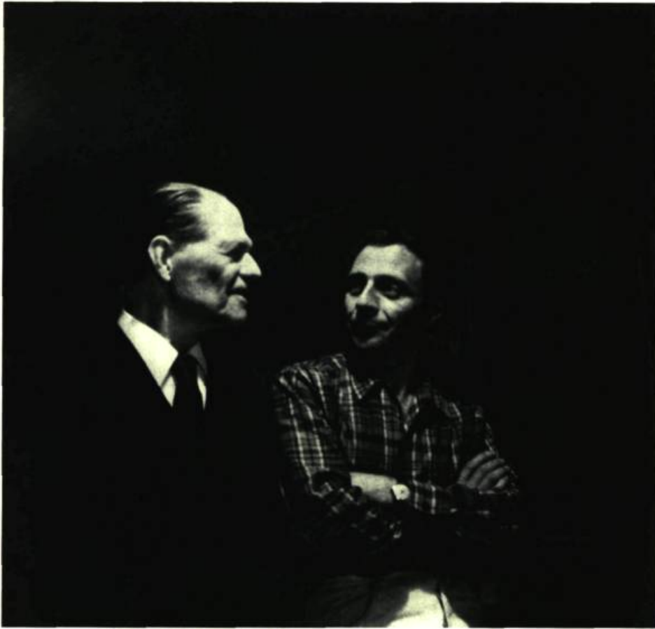
2. Chopin en compagnie de Raoul Hausmann, en juillet 1966, après l'enregistrement phonétique sur magnetophone, le dernier d'Hausmann fondateur avec Huelssenbeck, du Dadaïsme à Berlin en 1918.