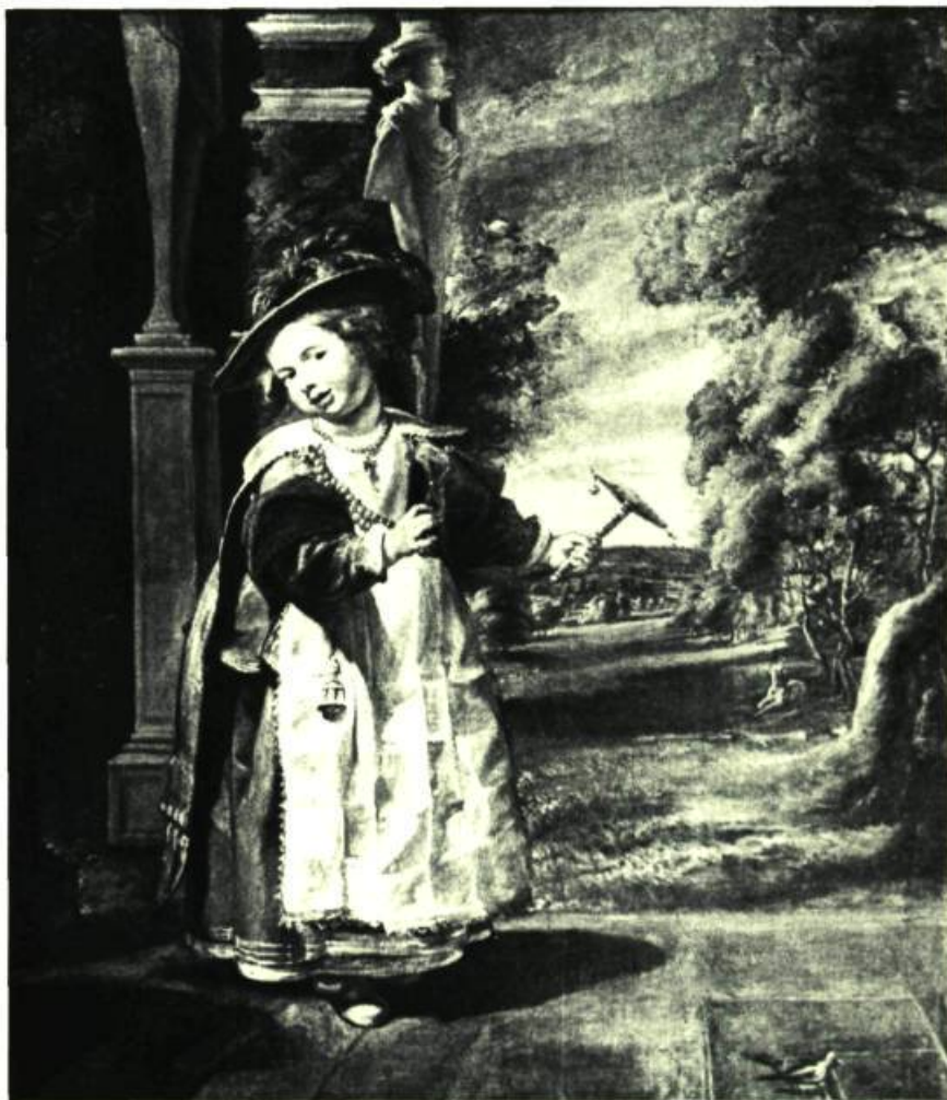
Ci-contre: Portrait d'enfant . Huile sur toile. 52 1/2" x 44 1/4" (133,5 x 113 cm). Trustees of the Warwick Castle Resettlement, Angleterre.

troublé par des questions religieuses, finit par abjurer le catholicisme et adhéra au protestantisme ainsi que l'avait fait sa femme. Il mourut en 1678 à l'âge de 85 ans et fut enterré dans une église protestante à Putte en Hollande. Célèbre, alors qu'il était encore jeune, Jordaens vit les commandes affluer. Sa production fut abondante et variée. Son plus ancien tableau connu, le Christ en croix fut peint vers 1617. L'année suivante, dans une Adoration des Mages , commencent à se faire jour les caractéristiques qui demeurent présentes tout le long de sa carrière, en particulier l'opposition de la lumière et des ombres. Ce sujet qui fut un de ses préférés sera souvent repris. Parmi les autres sujets religieux traités par Jordaens, signalons: Les Fiançailles de Sainte-Catherine , vers 1641, la Tentation , le Denier de Saint-Pierre , la Pêche miraculeuse , Saint-Yves , patron des avocats , Jésus parmi les Docteurs , les Quatre Évangélistes .