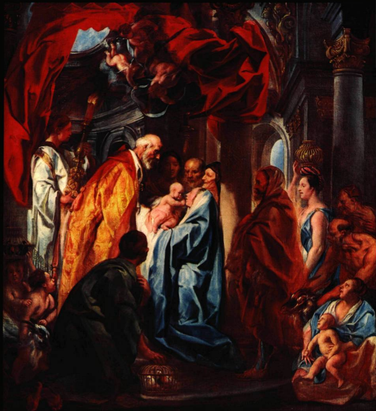
La présentation au Temple, Galerie de l'Université Bob Jones, Greenville, Caroline du Sud, États-Unis.