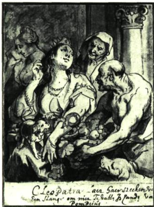
Ci-dessus: La mort de Cléopâtre . Dessin à l'encre et lavis brun rehaussé de ton verdâtre à l'aquarelle. Collection M. Antal Dorati, Londres.