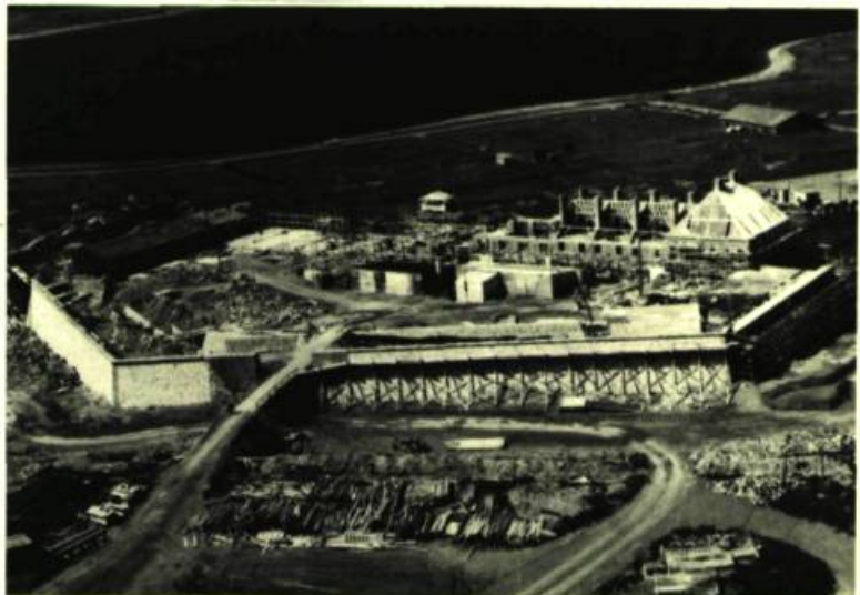
Ci-dessus, haut: vue du Château Saint-Louis, vers 1733. Bibliothèque de l' Arsenal, Paris ; milieu: vue nord-ouest des ruines de Louisbourg par Thomas Wright, en 1766 ; bas: vue aérienne récente des chantiers de construction du Bastion Royal et du Château Saint-Louis.