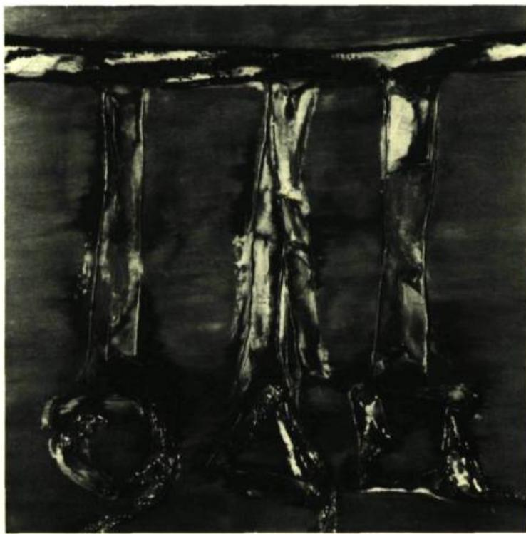
Page ci-contre : S. Fan V , 1965. Huile sur toile, 31¼" x 25¼" (81 x 65 cm)

C'est à travers une forte culture littéraire que Koenig, qui à cette époque écrit volontiers des poèmes ou des lettres-poèmes, perçoit ces influences divergentes et les transcrit dans sa pein-