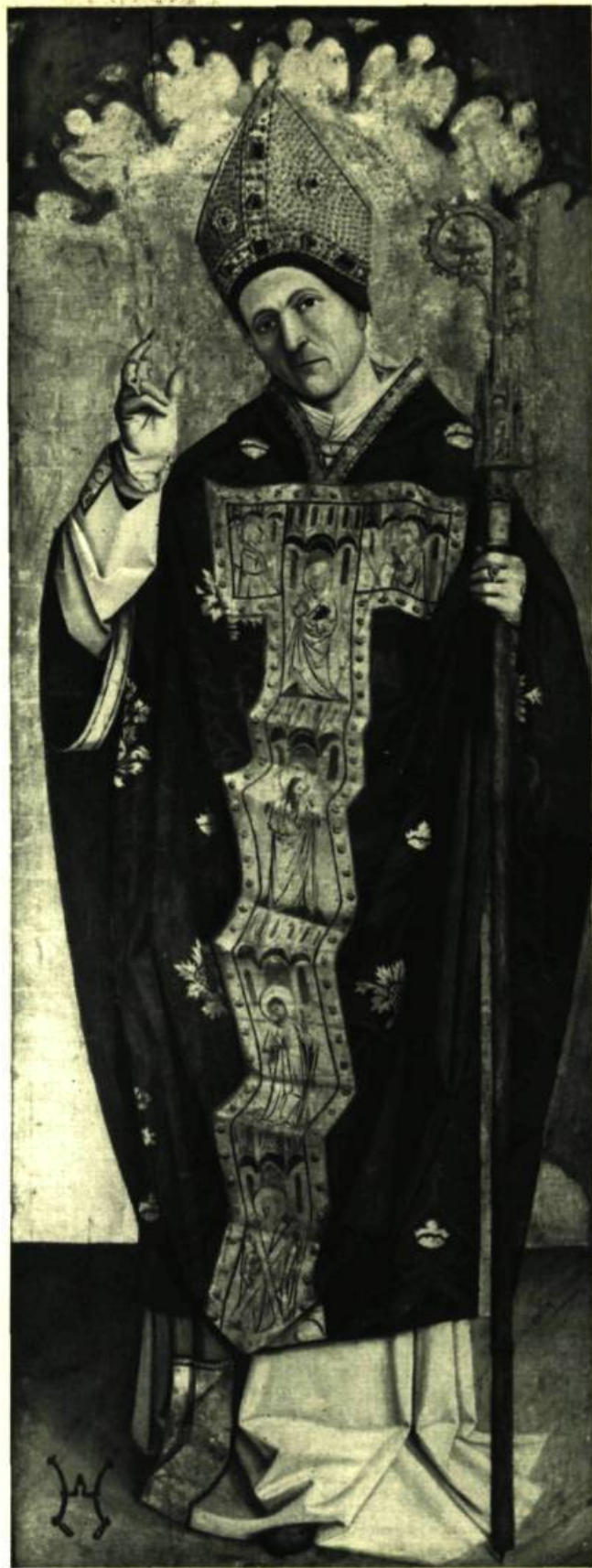
Page ci-contre: Maître de Saint Sébastien: La circoncision. 31 3/4" x 23 3/4" (80 x 60 cm). Musée Calvet, Avignon. Ci-dessus: Nicolas Froment: Saint Siffren, évêque de Carpentras. Peinture à l'œuf sur bois, fond or. 81 1/2" x 26" (207 x 66 cm).