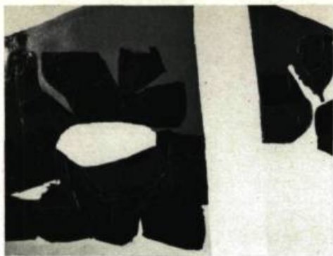
60—Jean LeFebure. Palmeraie , 1965, huile, 28 \frac{3}{4} " x 36 \frac{1}{4} " (73 x 92 cm). Galerie Soixante .