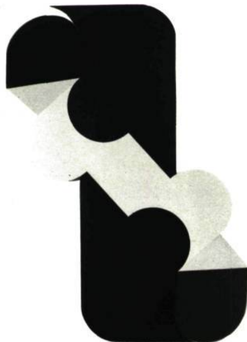
61—Henry Saxe. Ping Pong , 1965, acrylic sur panneau, 56" x 33" (142, 25 x 83.8 cm).

Saxe aime les formes industrielles qui suivent une esthétique géométrique respectant leur matériau et leur condition de production. Il voudrait procéder de la même façon pour créer un objet d'art unique et personnel qui soit en rapport avec notre temps. En travaillant avec des formes en trois dimensions dans l'espace réel, il veut donner au spectateur l'illusion que tout se ramène à une surface plate et vice-versa. Ses objets ne sont pas des sculptures parce qu'on ne peut tourner autour. Il parodie le domaine des projections isométriques et établit un dualisme entre la forme dessinée en projection pour donner l'impression d'être tridimensionnelle et la forme réelle dans les trois dimensions, réalisée pour donner l'impression d'être un dessin en projection.