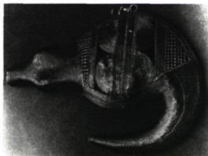
Pendentif en or. Musée d'Abidjan, Côte d'Ivoire. Tête de bélier. Cire perdue.