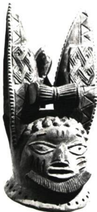
Masque de danse. Gélédi (Société d'hommes pour célébrer les rites de la fécondité.) Bois colorié. Yoruba, Nigéria.