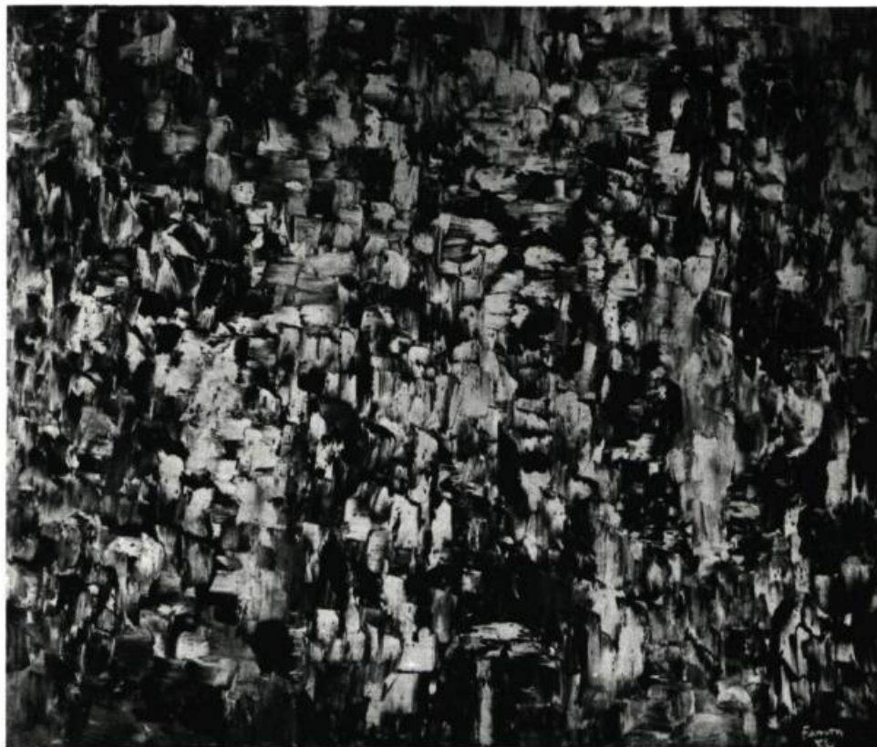
Composition. 1962 84" x 60" (213,35 x 152,4 cm)