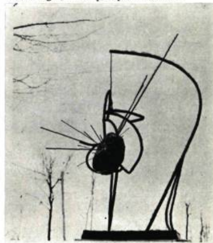
Jean Gauguet-Larouche Sculpture métal, 1964, 60" (153 cm)