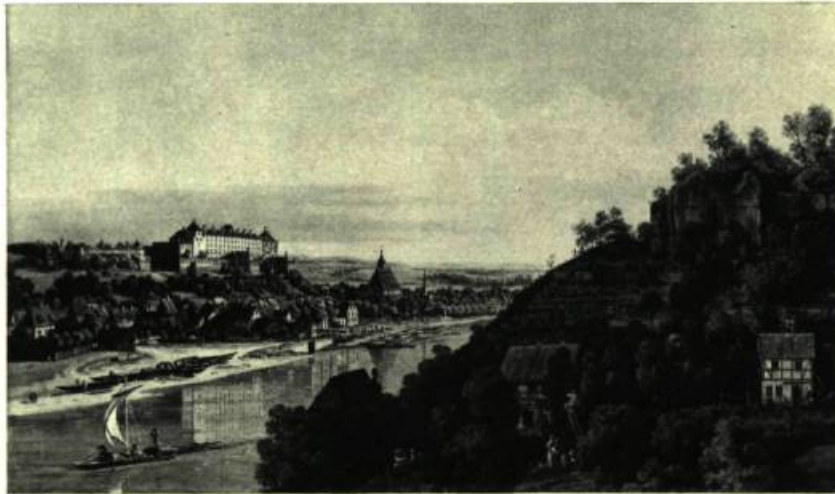
ci-contre: Bernardo Bellotto (1720-1780) Chateau Sonnenstein sur l'Elbe à Pirna Huile sur toile 18 \frac{7}{8} " x 31 \frac{1}{2} " (48 x 80 cm) Collection de F. Kleinberger and Co. Inc. New York

A la différence de Canaletto, Guardi invente ou du moins travaille plus de mémoire. L'élan de l'imagination et la turbulence de l'esprit remplacent ici la minutie de l'observation canaletienne. La lumière de Guardi n'est pas la luminosité diffuse de Canaletto, c'est plutôt un jeu de reflets et de scintillements dans tout le tableau qui, dans son élégance frivole, devient rococo.