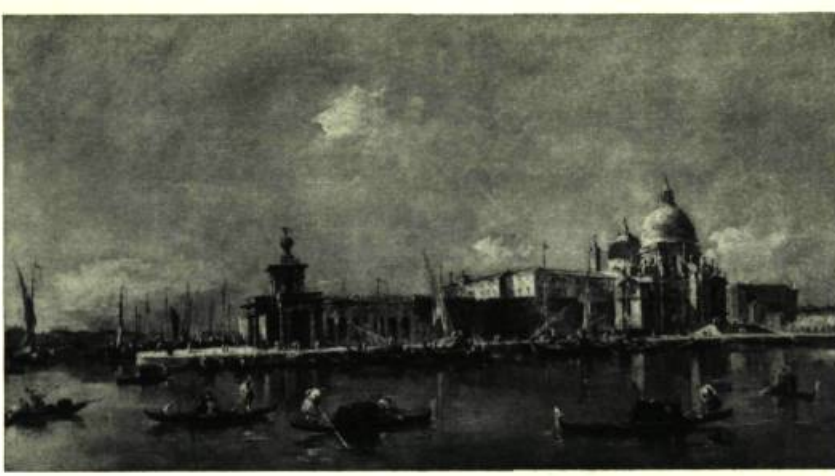
ci-contre: Francesco Guardi (1712-1793) Santa Maria della Salute Huile sur toile 19 \frac{1}{2} " x 35 \frac{1}{2} " (49,5 x 90,2 cm) Museum of Fine Arts, Houston

A la différence de Canaletto, Guardi invente ou du moins travaille plus de mémoire. L'élan de l'imagination et la turbulence de l'esprit remplacent ici la minutie de l'observation canaletienne. La lumière de Guardi n'est pas la luminosité diffuse de Canaletto, c'est plutôt un jeu de reflets et de scintillements dans tout le tableau qui, dans son élégance frivole, devient rococo.