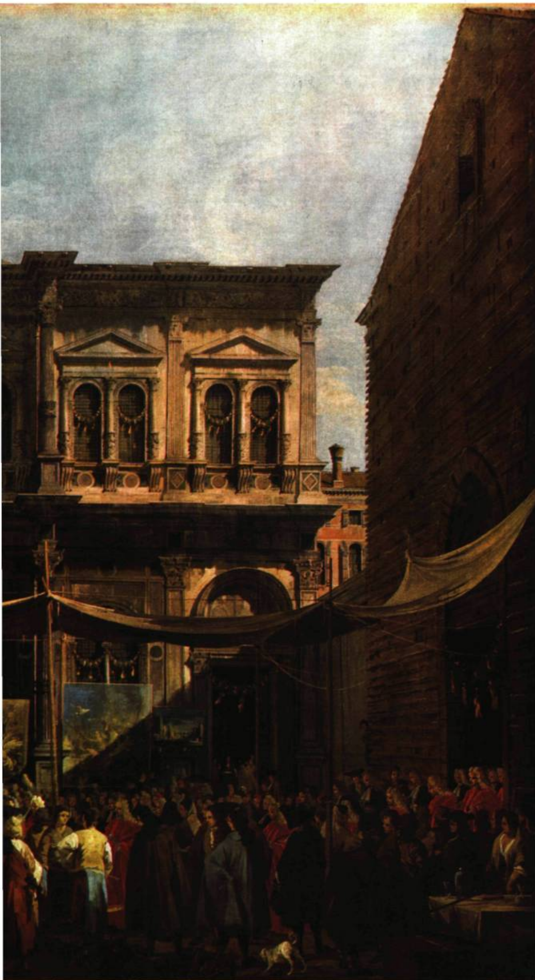
Venise: La fête de San Rocco Huile sur toile 58½'' x 78½'' (148 x 199 cm) The National Gallery, Londres