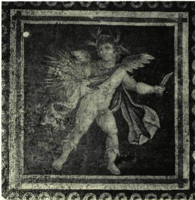
House of the Red Pavement. Figure allégorique représentant l'été.