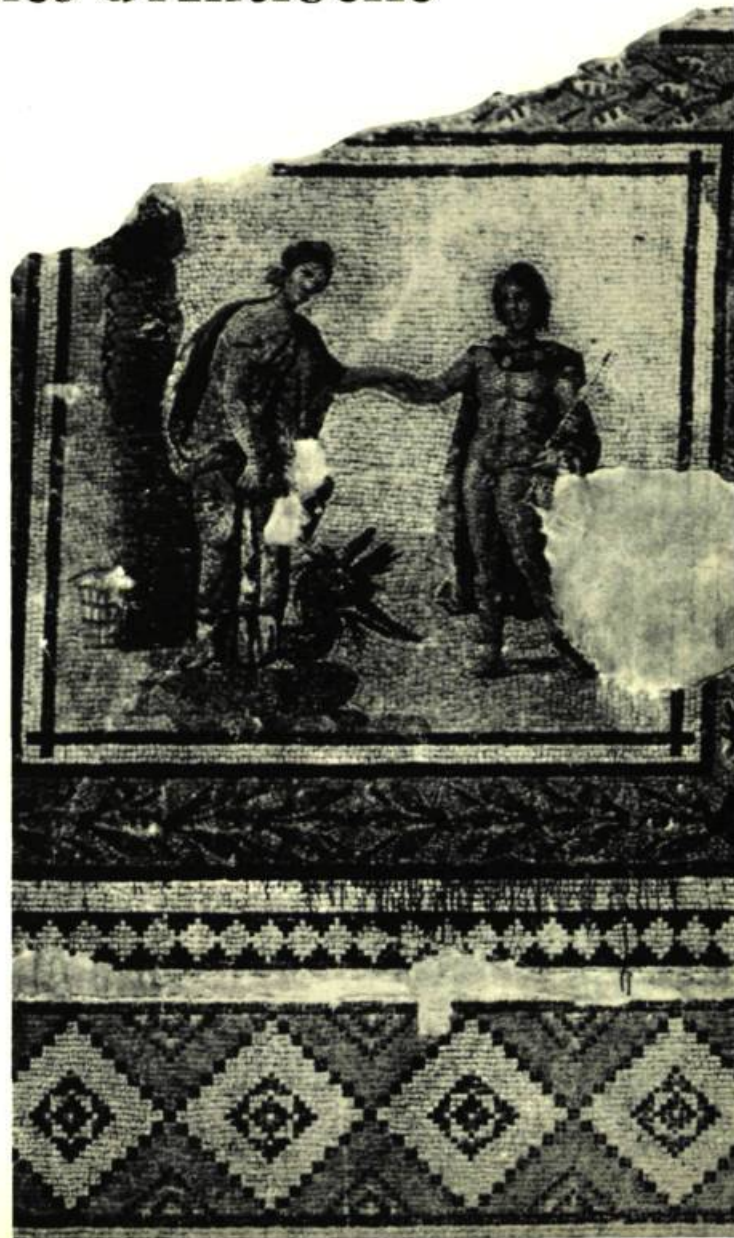
Maison de Dionysos et d'Ariane. Décor d'un couloir.