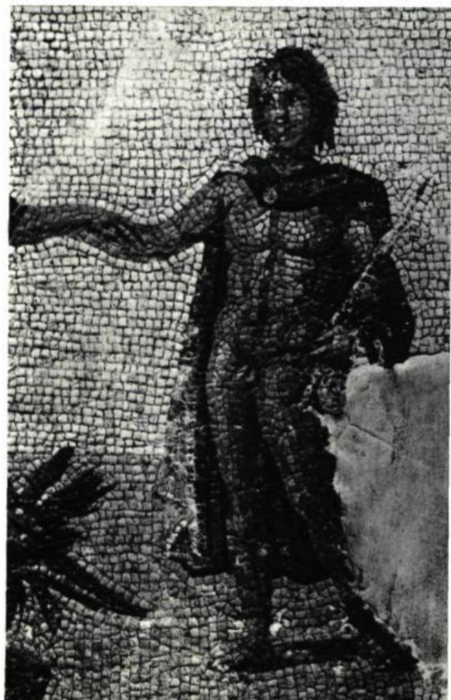
Maison de Dionysos et d'Ariane. Persée (détail).

le rouge du manteau qui, dans un but évident, a été rejeté derrière le dos de la figure par l'artiste. En fait, nous assistons à une scène qui n'a plus rien de dramatique. Le monstre a été tué et Andromède va partir avec son libérateur qui est, en même temps, un homme du monde.