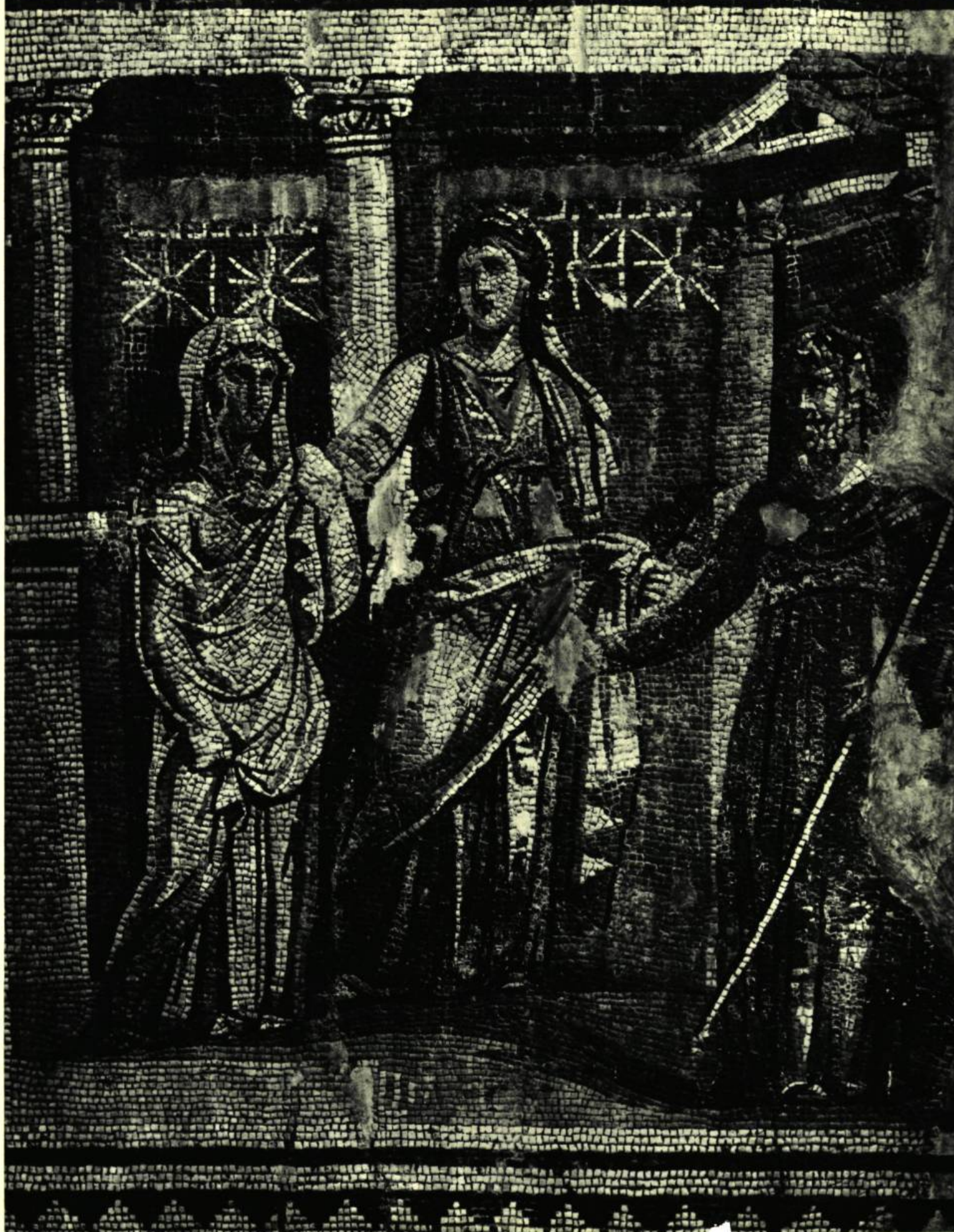
Maison d'Iphigénie. Iphigénie, Clytemnestre et Agamemnon.