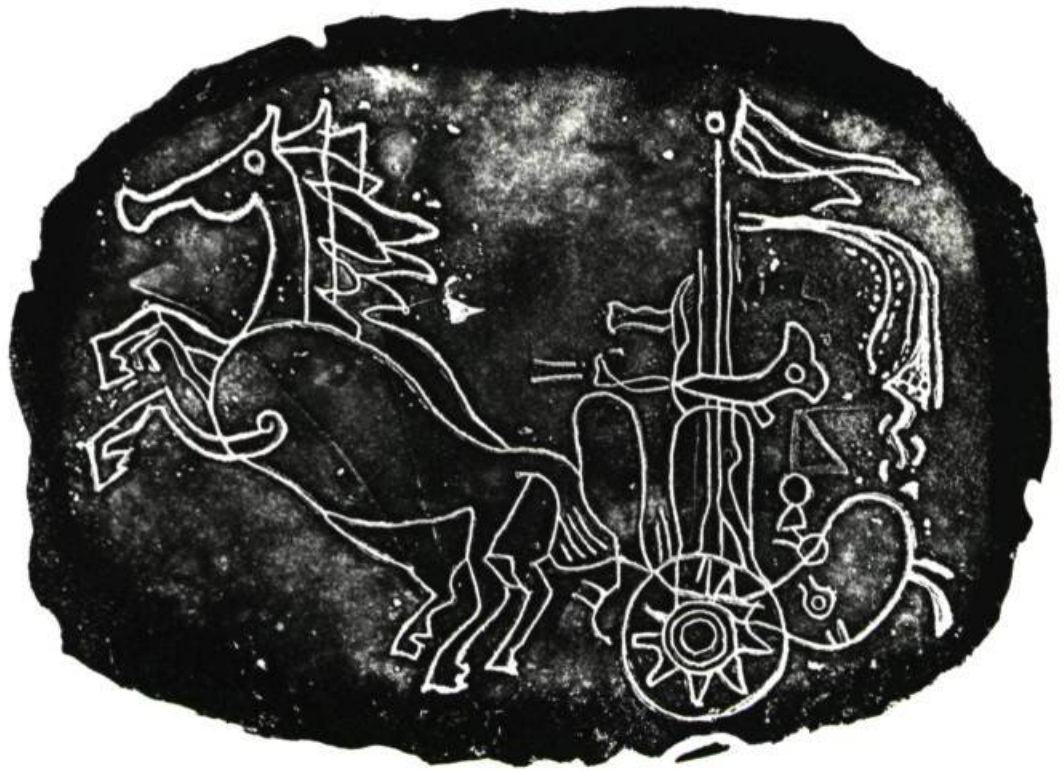
Page ci-contre : GALTIÉ Toulouse-Lautrec Médaille, recto Hôtel des Monnaies, Paris