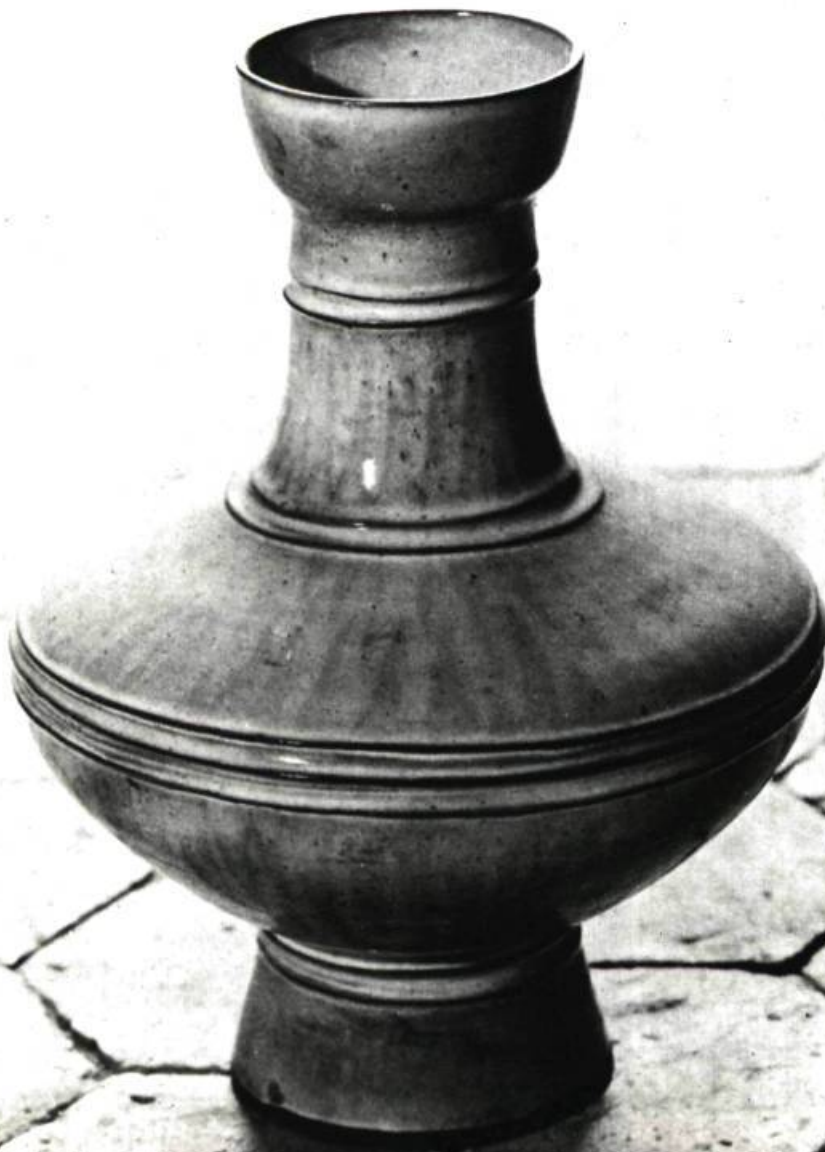
Ci-dessous : Francine DEL PIERRE Vase en faïence dure 17 \frac{3}{8} " x 10 \frac{3}{8} " (43 x 27 cm) Appartient à l'artiste.