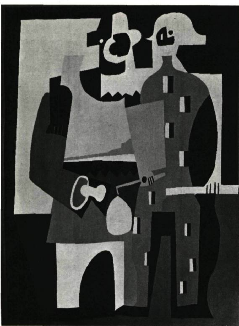
Page ci-contre : Victor VASARELY. Ibadan. Tapis haute laine noué à la main. Ateliers France-Tapis, Beauvais 98½" à 118¼" (2,5 x 3 m). Galerie La Demeure, Paris.