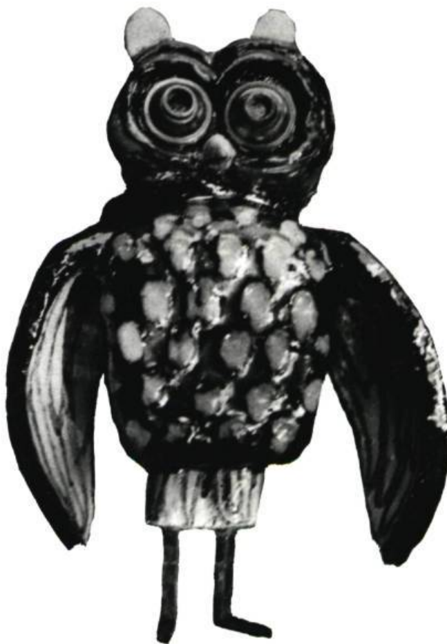
Ci-dessus: Guidette CARBONELL. Oiseau. Céramique. Hauteur: 11 \frac{3}{4} " (30 cm). Appartient à l'artiste.