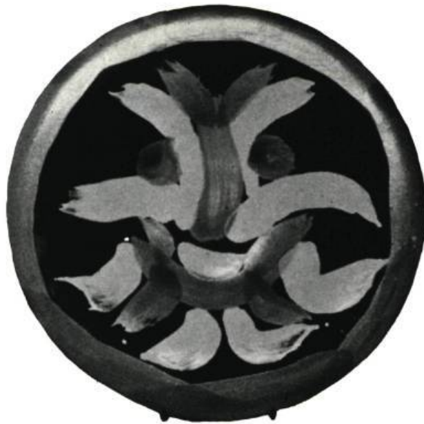
Ci-contre : Pablo PICASSO. Assiette. Céramique, 1963. Atelier Madoura, Vallauris.