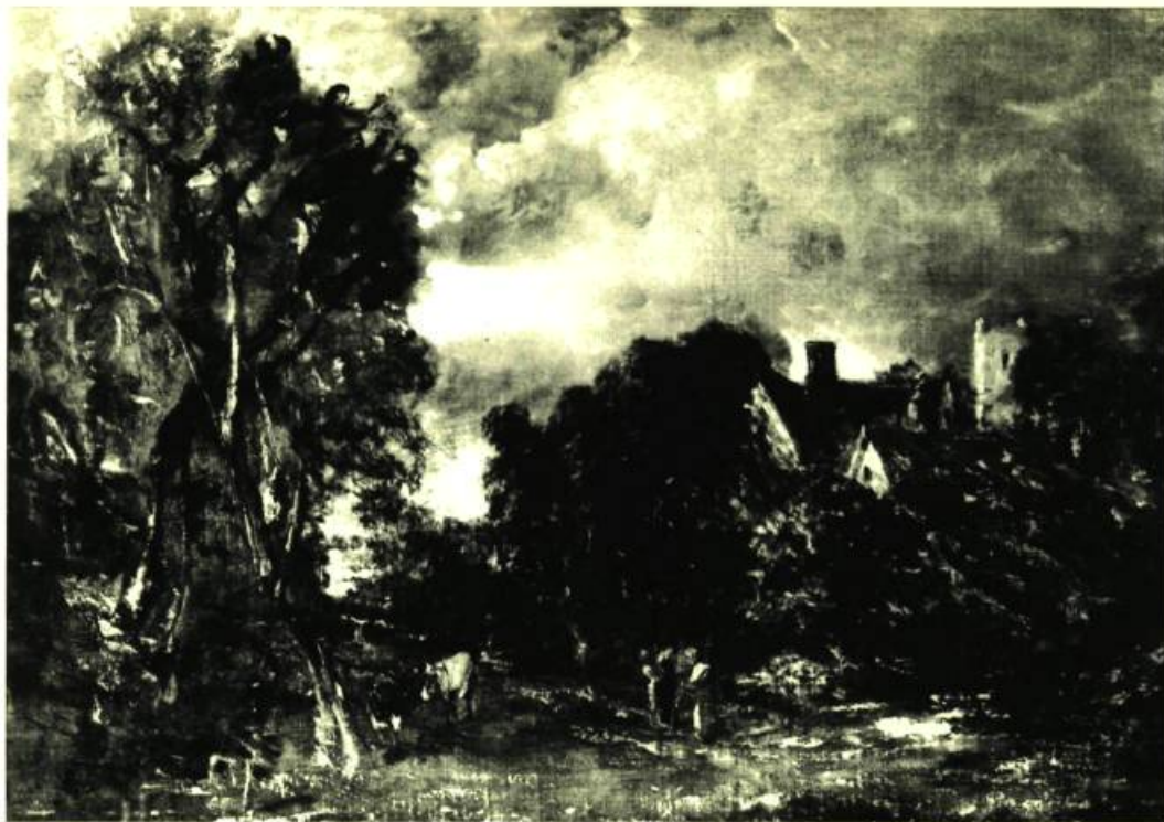
John Constable. (East Bergholt 1776 - Londres 1837). The Glebe Farm. Vers 1827. Huile sur toile. 17 \frac{3}{4} " x 25 \frac{1}{2} " (45,20 x 65 cm). Collection du Musée des Beaux-Arts de Montréal.

LES premiers colons français avaient apporté au Canada quelques toiles d'intérêt mineur. Plus tard, il y eut à Québec, aux environs de 1800, un groupe de collectionneurs dont les tableaux, — originaux et copies —, furent le point de départ de la collection actuelle de l'Université Laval. Malgré tout, on peut affirmer sans crainte que pendant plusieurs années, les nouveaux colons consacrèrent toutes leurs énergies à assurer la sécurité économique et l'unité politique du nouveau territoire. Il ne se fit vraiment de collection valable au Canada qu'après la confédération des différentes parties du pays, en 1867.