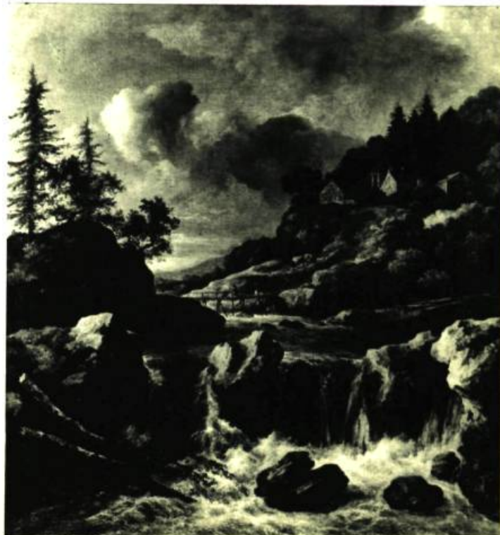
Jacob van Ruysdael. (Haarlem 1628-29 - Amsterdam 1682). La chute. Collection de la Galerie nationale du Canada.

cette époque si on se reporte au goût qui prévalait à Montréal et même dans toute l'Amérique du Nord. Homme de génie, Sir William Van Horne, constructeur des sections les plus ardues du chemin de fer du Pacifique Canadien, fut l'unique instigateur de cette collection exceptionnelle. Sir William possédait plus de 400 tableaux, parmi lesquels on comptait à sa mort, survenue en 1915, un Cima de Conegliano, deux Rubens, un