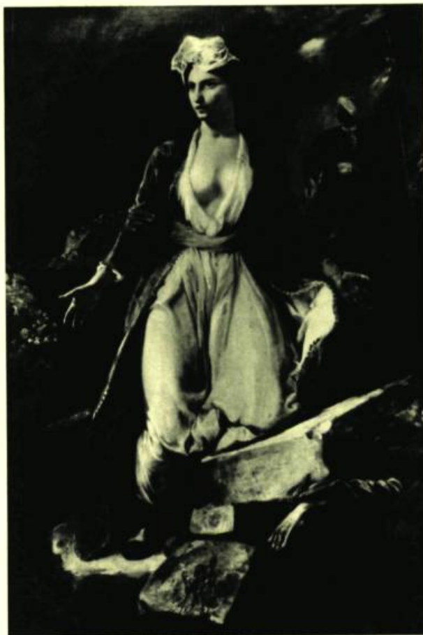
Eugène DELACROIX. (Charenton 1798 - Paris 1863). La Grèce expirante sur les ruines de Missolonghi.

Après avoir été un village de pêcheurs, cette bourgade que les Romains développèrent et dont les ruines du Palais Gallien où quelques stèles archéologiques attestent le passage, est devenue ce qu'ont voulu les hommes, c'est-à-dire un carrefour de voies maritimes et terrestres : chaque siècle a trouvé le sien, qu'il soit