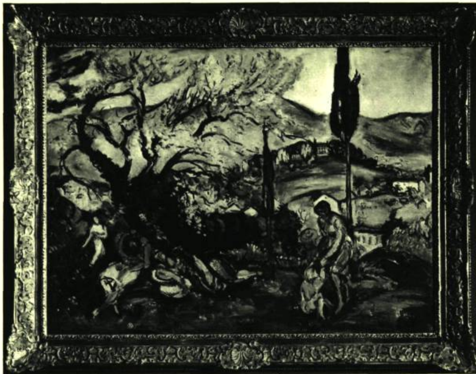
Ci-contre : Othon Friesz, peintre et graveur. (Le Havre 1879 — Paris 1949). Printemps à Toulon. Huile. Ci-dessous : Vase sculpté. Renaissance italienne. Marbre. (XVIIe siècle).