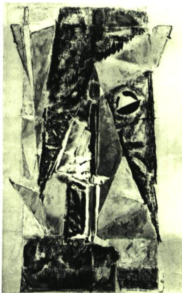
SYLÈNE Crayon et gouache, 14" x 24" (35,65 x 61 cm.) Figure dimensionnelle en équilibre instable comme l'évocation surréelle d'un mythe. Ainsi certains graphismes ont le pouvoir de remuer en raccourci, de suggérer en apparence des visions intérieures projetées hors de soi dans une écriture impulsive. Un oeil de cyclope se tourne vers l'intrados d'une construction géométrique aiguë dont la nervure soutient la poussée. Une provocation de l'artiste à la recherche d'une expression dynamique.