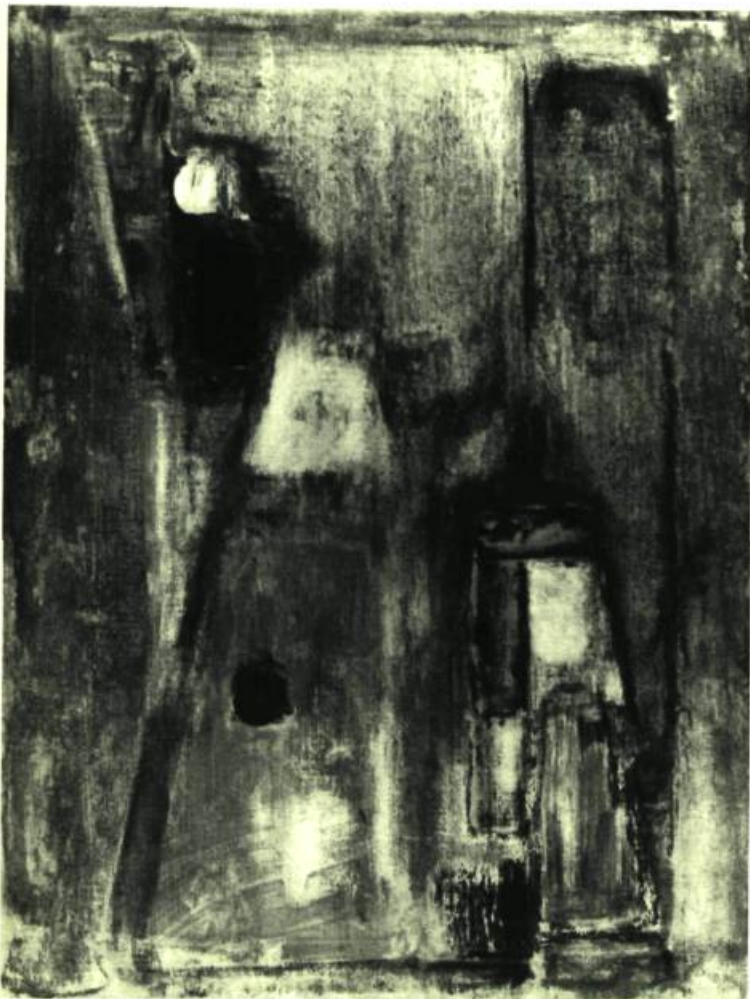
PRÉSENCE , Crayon à l'huile 12" x 16" (30,50 x 40,75 cm.) Un écran de lueurs diffuses affine le mouvement concentré, presque évanescent, de l'élément graphique dans cette oeuvre intimiste. Dans l'aube on y lirait un gnome affairé à jauger un réverbère en clair-obscur, indifférent à la chute d'un fruit mûr issu d'un réceptacle de lumière; au fond une curiosité amusée, meublée par l'idée réceptive de se réverbérer, guide l'acte du tableau et lui donne sa réalité.