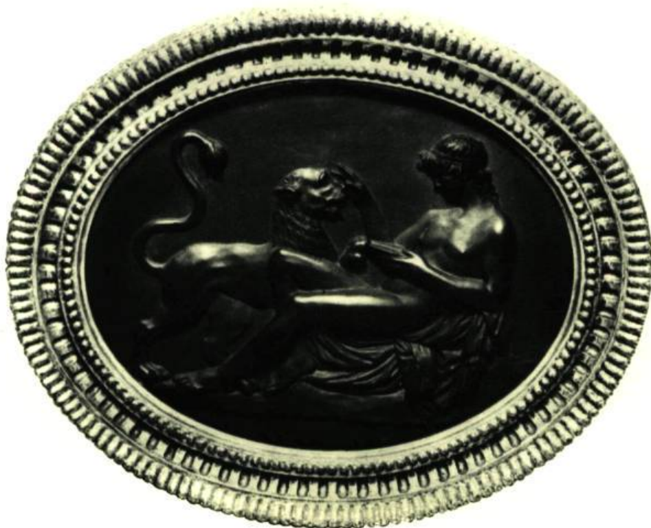
Médaillon. Jasper. Bas-relief. "Bacchus à la Panthère" 1772. Musée des Beaux-Arts de Montréal.

Quoiqu'on dise, il a créé un style que l'on ne peut confondre avec aucun autre. On l'a imité en France, en Allemagne et dans toute l'Europe. On dit aujourd'hui un wedgwood comme on dit un delft ou un strasbourg, et c'est peut-être, ce qui montre qu'il est le plus grand céramiste anglais.