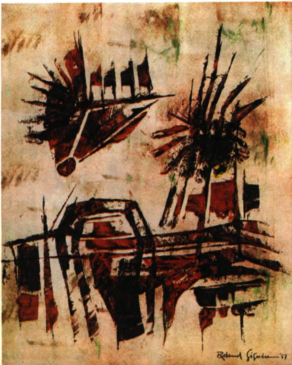
CHASATONGA encre d'imprimerie août 1957.