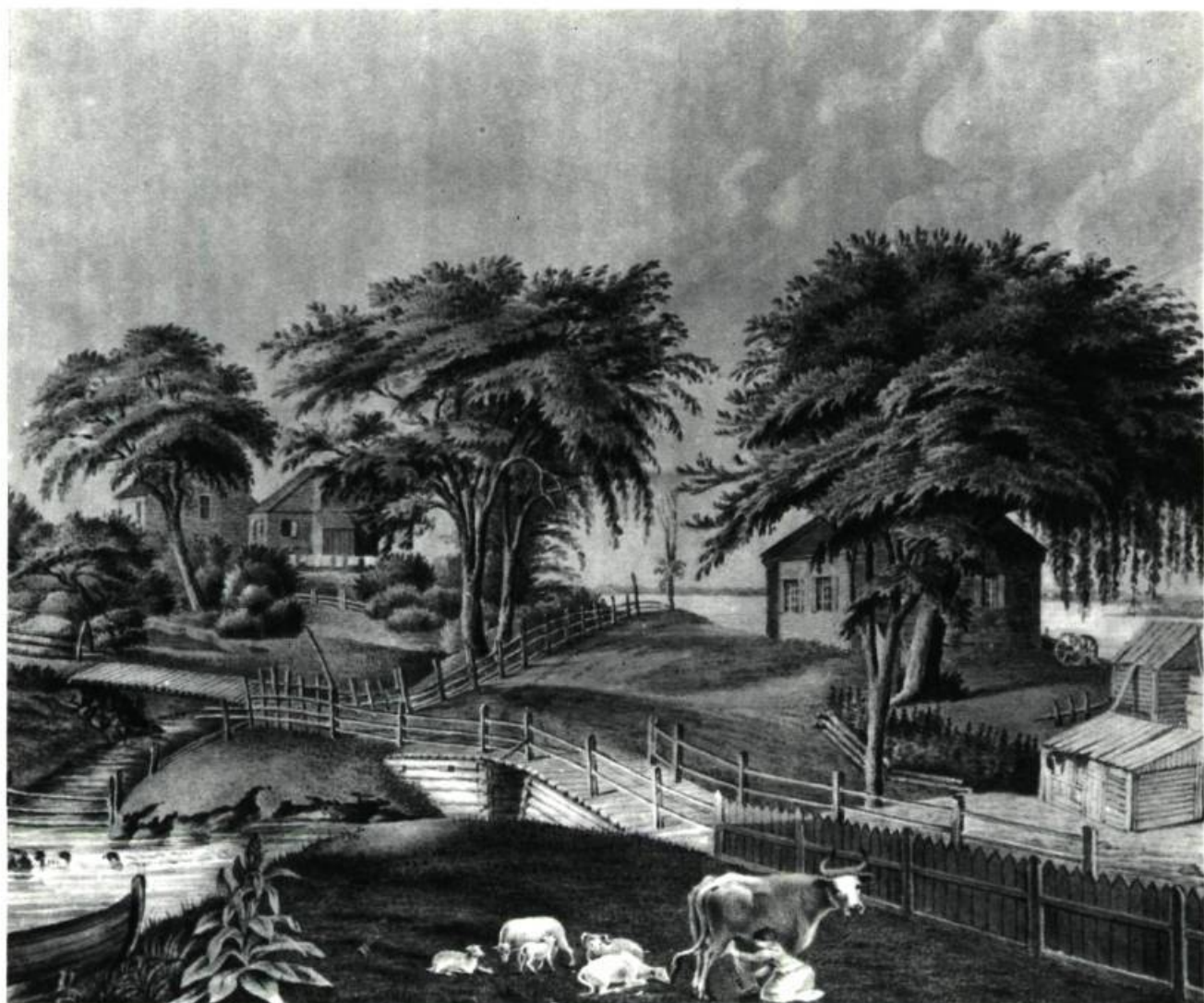
MONTREAL — Bibliothèque municipale ( Album Viger ). « Site du combat de la Grange, 25 Septembre 1775. Au Ruisseau des Soeurs, paroisse de la Longue-Pointe, île de Montréal, 1839. » Dessin naïf. Coloris vert bleuté. Les détails sont très soignés.

H. O' 7 \frac{7}{8} " L. O' 9 \frac{3}{8} " Aq.