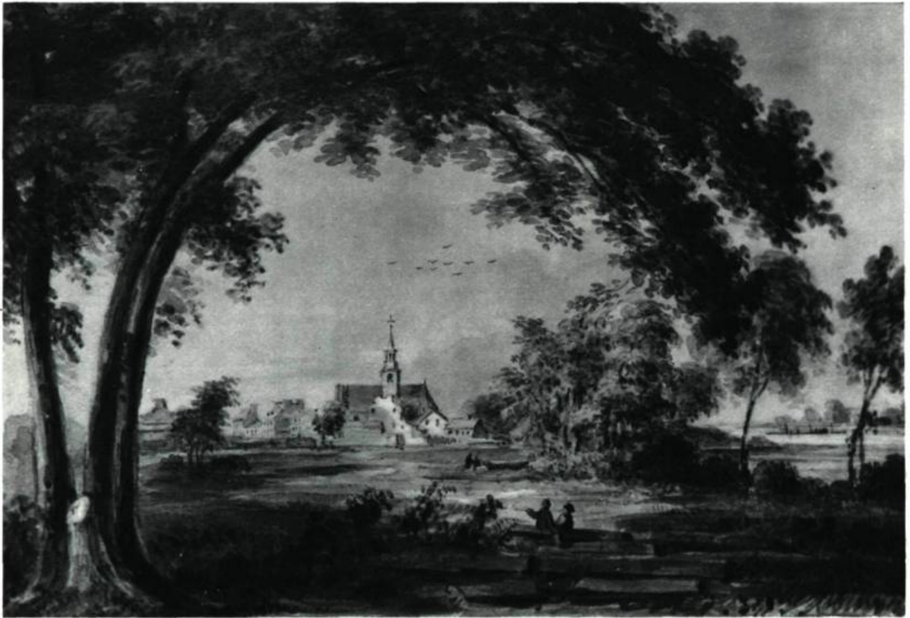
« Village de Sainte Geneviève, île de Montréal (1831 - 10 août) » — A gauche, un orme à trois grosses branches, dont l'une est bandée en arc de gauche à droite. Premier plan de pièces de bois équarries, sur lesquelles il y a deux enfants vêtus de bleu. Au loin, l'église de Pierrefonds avec sa tour sur le côté, et quelques maisons. A droite, la rivière des Prairies.

H. O' 5 \frac{7}{8} " L. O' 8 \frac{5}{16} " Aq.