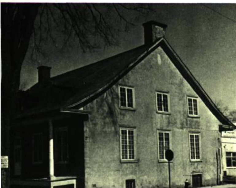
LONGUEUIL — Habitation en pierre des champs, située à l'angle du chemin de Chambly et de la route de Sorel. (Service de CINÉ-PHOTOGRAPHIE, Prov. de Québec).

A propos d'un petit problème de circulation, relativement facile à régler d'ailleurs, faites appel à l'expérience des Egyptiens, à nos ancêtres du Moyen-Age (qui, semble-t-il, n'avaient pas les mêmes besoins que nous), au progrès tout en majuscules, au "fardeau des restaurateurs, des hôteliers et des stations de police", agitez le spectre des W.C. de tavernes où vous de-