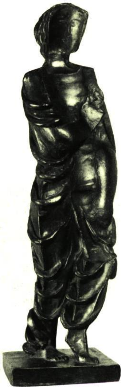
FIGURINE DRAPÉE (1930) BRONZE. HAUTEUR : 26 POUCES NUMÉRO DE FONTE : 4e SUR 5 APPARTIENT À L'ARTISTE.