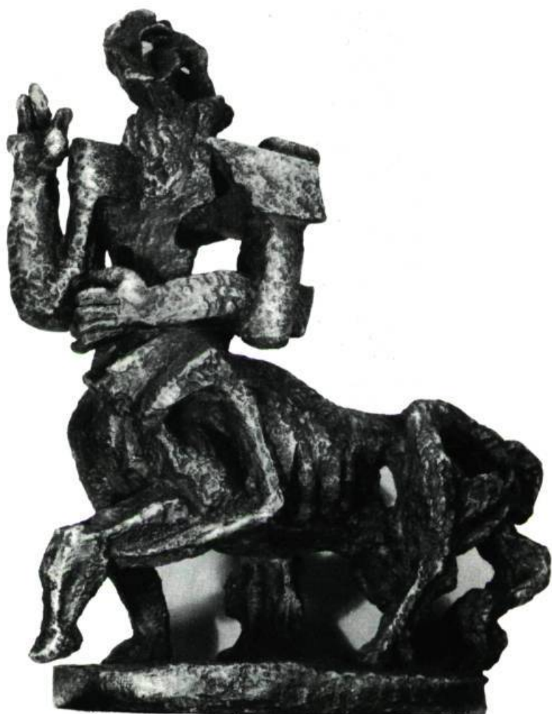
ORPHÉE (1948) BRONZE. HAUTEUR : 86 POUCES NUMÉRO DE FONTE : 4e SUR 4 APPARTIENT À L'ARTISTE.