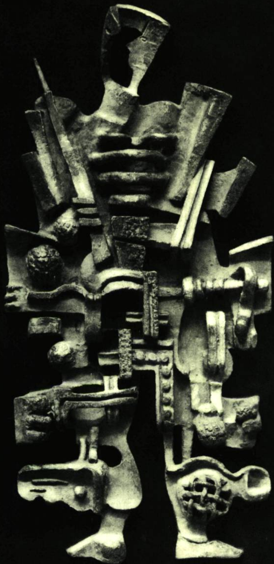
LE GUERRIER haut relief (1943) BRONZE. HAUTEUR : 45 POUCES NUMÉRO DE FONTE 1er SUR 3 APPARTIENT À L'ART