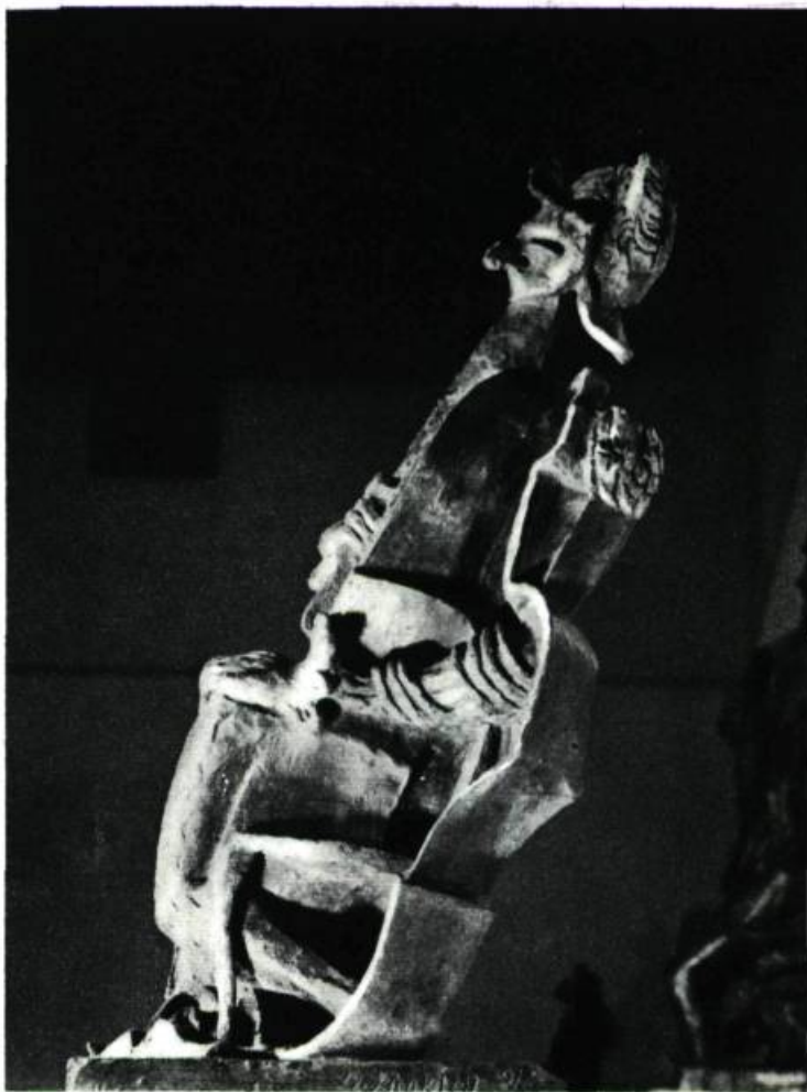
LE VIOLONCELLISTE (1927) BRONZE. HAUTEUR : 18 POUCES NUMÉRO DE FONTE : 2e SUR 5 APPARTIENT À L'ARTISTE.

leurs mains chérubines, il devient une baguette magique de laquelle ils frappent le papier pour que des mondes insoupçonnés, ensevelis, s'élèvent du fond silencieux du rêve ... Et ces paysages aux bêtes et oiseaux merveilleux, dire qu'aucun géographe n'en a jamais parlé dans ses livres savants ... L'enfant n'est pas un artiste, c'est un médium, — un médium génial en ce qu'il produit des oeuvres que caractérise l'absence de moyens et de trucs, une sorte d'austérité, que caractérise la non-illustrativité.