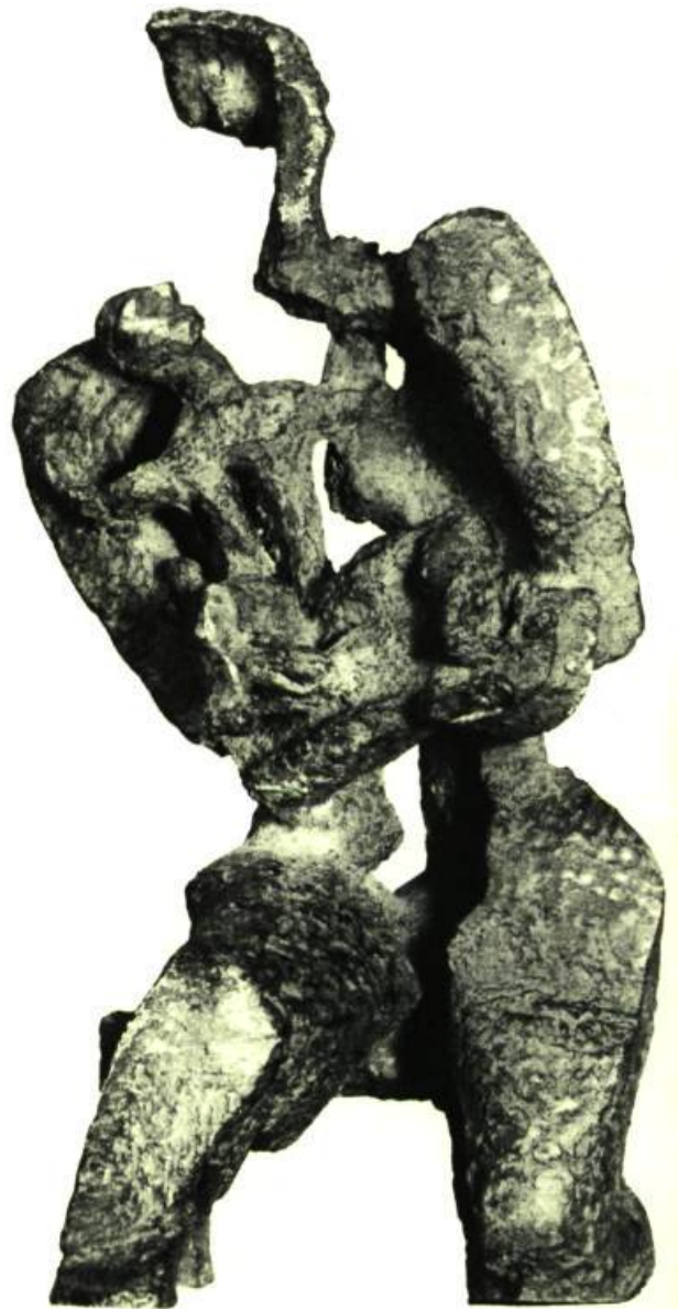
MATERNITÉ BRONZE. HAUTEUR : 17 POUCES NUMÉRO DE FONTE : 2e SUR 5 APPARTIENT À L'ARTISTE.