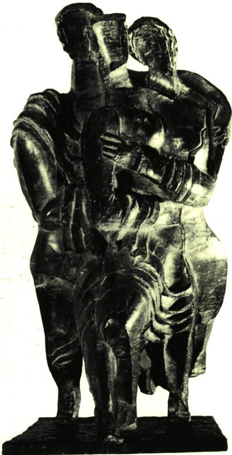
LES MÉNADES (1935) BRONZE. HAUTEUR : 29 POUCES ÉPREUVE D'ARTISTE APPARTIENT À L'ARTISTE.