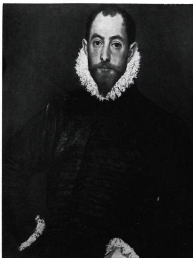
El Señor de la Casa de Leiva par LE GRÉCO. Cliché Musée des Beaux-Arts de Montréal

Le terme vieux maître , au point de vue marché d'art, s'applique au peintre mort depuis plus de cent cinquante ans et qui n'a jamais souffert de la défaveur du public. Avec ces données, il serait possible de dresser la liste suivante : les primitifs flamands; Van Eyck, Van der Weyden, Memling; les peintres flamands et hollandais des seizième et dix-septième siècles; Breughel le Vieux, Rubens, Van Dyck, Hals, Rembrandt, Ruisdaël, de Hooch