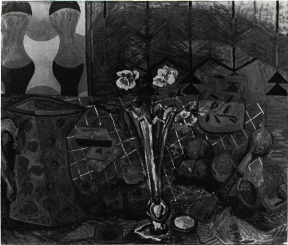
Une exposition des oeuvres de PELLAN se tient dans le Hall de l'Hôtel-de-Ville de Montréal du 6 au 30 novembre. Nous reviendrons sur les oeuvres de ce peintre dans un prochain numéro.