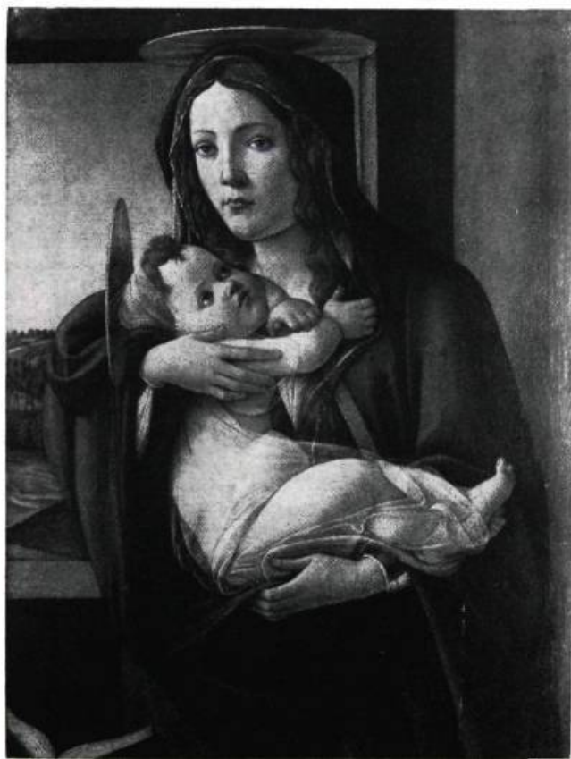
Madone et enfant par BOTTICELLI.

Selon Douglas Cooper, grand collectionneur qui assumait la restauration de châteaux du dix-huitième siècle dans le sud de la France et qui possède une des plus importantes collections de toiles cubistes, il existe seulement trois catégories quand on parle de marché d'art : les vieux maîtres, les Impressionnistes et les Post-Impressionnistes; entre ces catégories, il n'y a à peu près rien, toujours selon Douglas Cooper... Cette attitude pessimiste a du moins l'avantage de faciliter la compréhension d'un des marchés les plus complexes au monde.