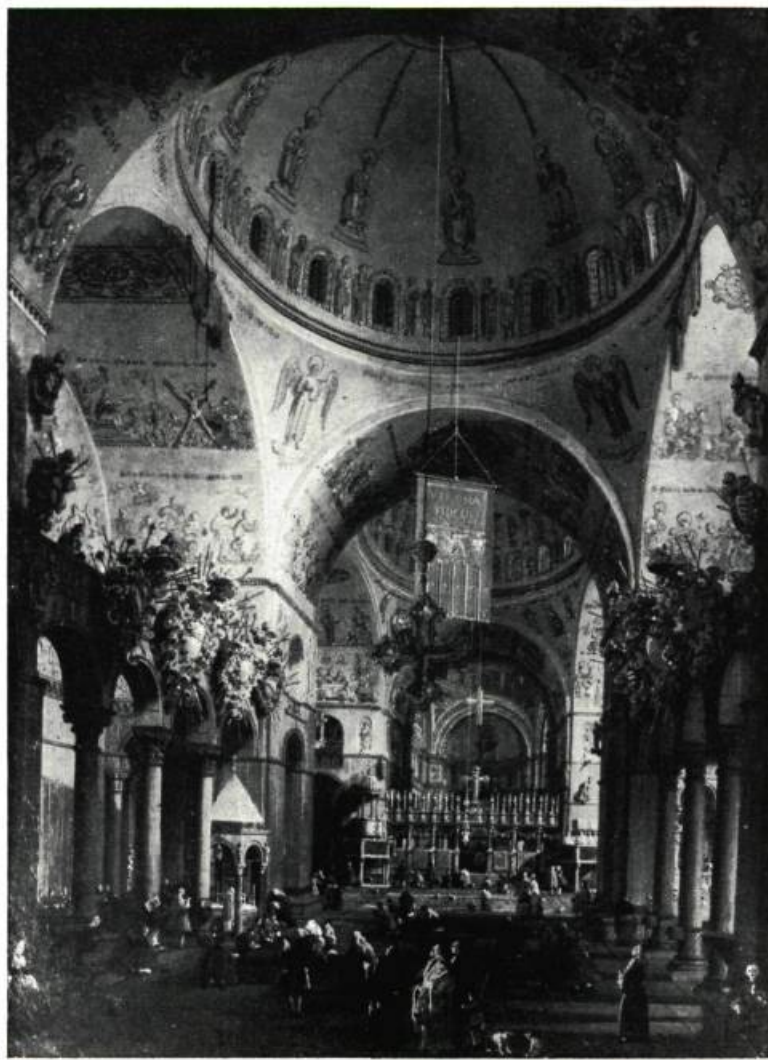
Intérieur de l'église Saint-Marc à Venise, toile par CANALETTO.

Londres, des peintres du dix-huitième siècle, tels que Guardi et Canaletto, commandaient récemment des prix de vingt-cinq mille deux cents dollars et de vingt-neuf mille quatre cents dollars, alors qu'il y quinze ans on aurait pu les acheter pour le vingtième de cette somme. Des dessins de deux artistes de la Renaissance, tels Lorenzo Lotto et Francesco dit Giorgio, furent vendus respectivement vingt-deux mille quatre cents dollars et vingt-cinq mille deux cents. Les mêmes exemples vaudraient pour le marché allemand et américain; d'ailleurs à New York, le Vieux Moulin, près de Cannes , de Soutine, qui fut vendu chez Parke-Bennett en 1945 pour la somme de deux mille cinq cents dollars, fut racheté au même endroit en 1954 par le Musée d'art Moderne de New-York pour la somme de vingt mille cinq cents dollars.