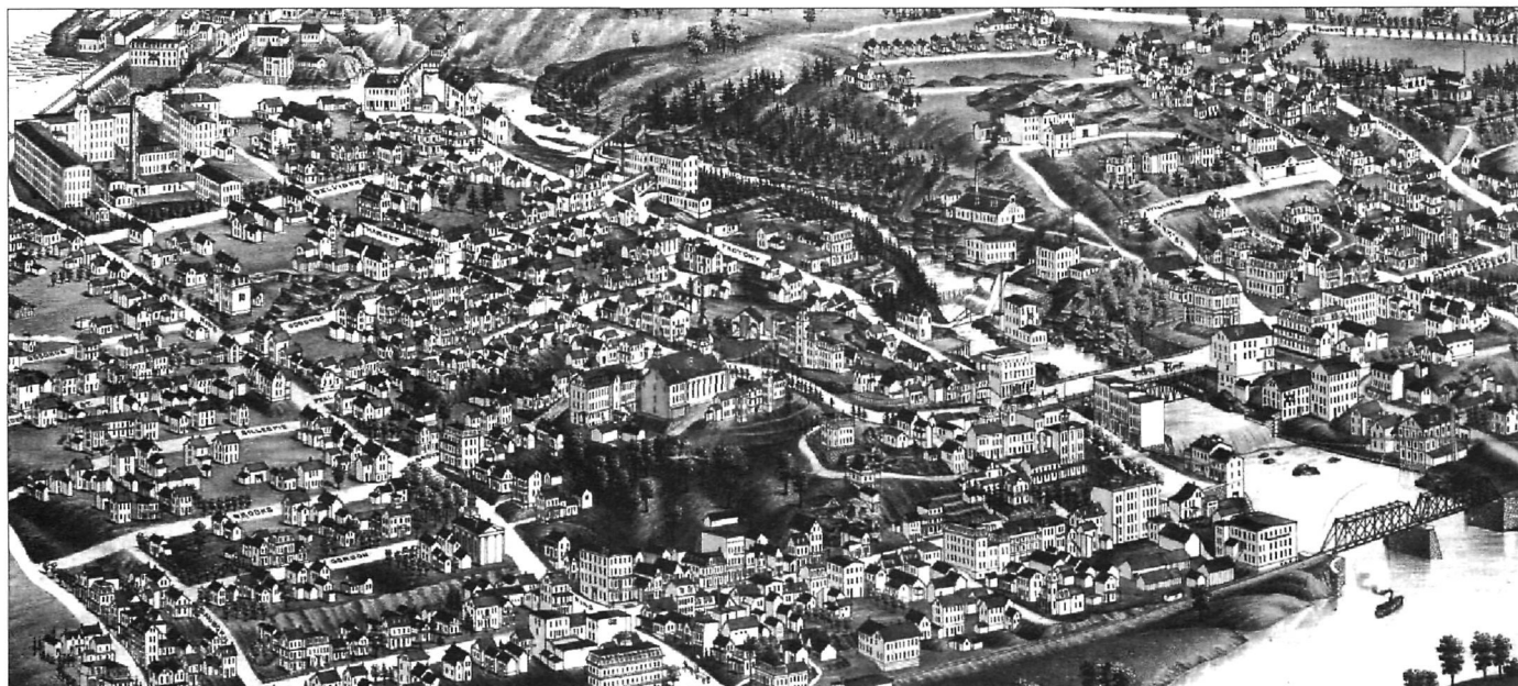
Extrait de H. Weilige, Bird's Eye View of Sherbrooke P. O. Madison, J.J. Stoner, 1881.