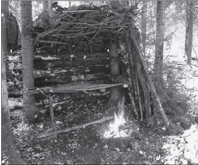
ILLUSTRATION 1 : Un exemple de savoir-faire technique : la confection d'un abri de survie de type « banc de parc » (photo : Manu Tranquard, LERPA).

Le deuxième facteur correspond à l'état psychologique de la victime, qui inclut notamment la force de caractère et la stabilité émotionnelle ainsi que la résilience. Ce facteur intègre également l'aptitude à mettre en place des réponses pour faire face à un événement stressant, et la faculté à mobiliser facilement des ressources psychologiques pour y parvenir. Cette « façon de s'ajuster aux situations difficiles » (Ray et al. , 1982) est incluse dans la notion de « coping », ou capacité d'accommodation et d'adaptation.