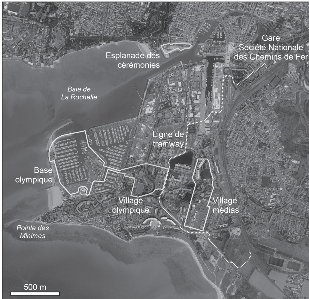
ILLUSTRATION 2 : Projet d'aménagement du village olympique, La Rochelle, Orthophotographie 2010, Institut Géographique National (carte : Dussier, 2014).

Autre argument important, les aménagements sont pour la grande majorité d'entre eux déjà réalisés (illustration 2). Cette situation présente un avantage économique, mais permet aussi d'éviter les risques liés à la planification et à la construction (non-respect des délais de livraison, malfaçon, conflits, réutilisation). Le coût de l'organisation serait donc de 26 millions d'euros et les délais pour réaliser les travaux de rénovation laisseraient des marges. De plus, Paris profitera de l'expérience acquise dans l'organisation d'autres manifestations sportives ce qui constitue toujours une garantie rassurante pour le CIO (Machemehl et Robène, 2014). La marina, les 20 000 m 2 de stationnements pour le village des coureurs et les bateaux, les trois cales de mises à l'eau, les 720 mètres de quais, la plage des Minimes constituent des espaces de circulation, de stockage, de stationnement et d'accès régis par des règles de fonctionnement qui ont déjà été éprouvées à l'occasion de compétitions non olympiques, mais dont les flux de sportifs, bateaux, journalistes et organisateurs sont comparables. La station météo complète le dispositif dans la mesure où elle donne des éléments de sécurité sur le site de pratique et permet une connaissance précise et utilisable de manière équitable du plan d'eau.