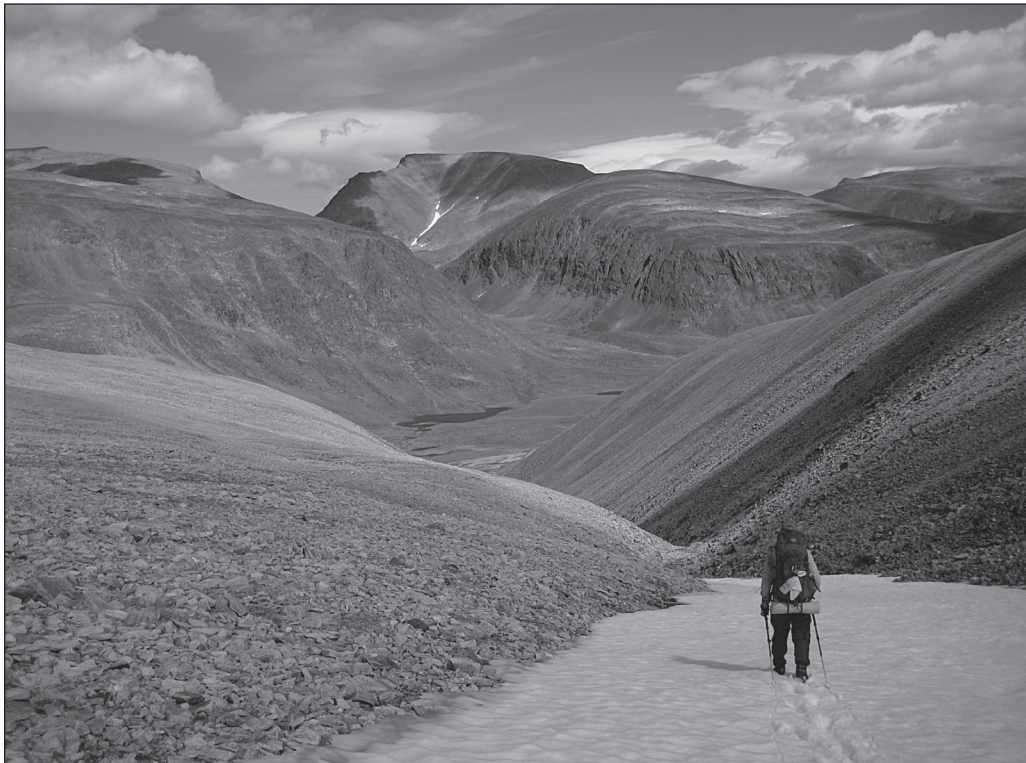
ILLUSTRATION 4 : Point de vue sur le futur parc national de la Kuururjuaq (photo : Stéphane Cossette, gracieuseté de l'Administration régionale Kativik (ARK)).

Telle que mentionnée à l'étape 4, la mise en place d'une coopérative de suivi socioenvironnemental pourrait servir de forum pour diffuser l'information obtenue lors du suivi et favoriserait l'implication des résidants à l'élaboration des nouveaux objectifs de gestion, si nécessaire. Ainsi, en plus de contribuer à l'acquisition de connaissances et au suivi de l'état des parcs gérés, une telle coopérative pourrait organiser des rencontres annuelles regroupant tous les groupes impliqués de près ou loin dans la gestion et le développement des parcs du Nunavik. Ces groupes de participants se trouveraient alors en situation d'apprentissage face aux mesures de gestion posées dans le passé (pour plus d'information sur l'apprentissage social et la cogestion, voir Armitage et al. , 2008). Ultimement, il incomberait au groupe responsable du développement des mesures de gestion de prendre les décisions nécessaires pour modifier et mettre en place les nouvelles mesures. La boucle de la cogestion adaptative recommencerait alors à l'étape 2, et ainsi de suite pour les décennies à venir (voir illustration 2).