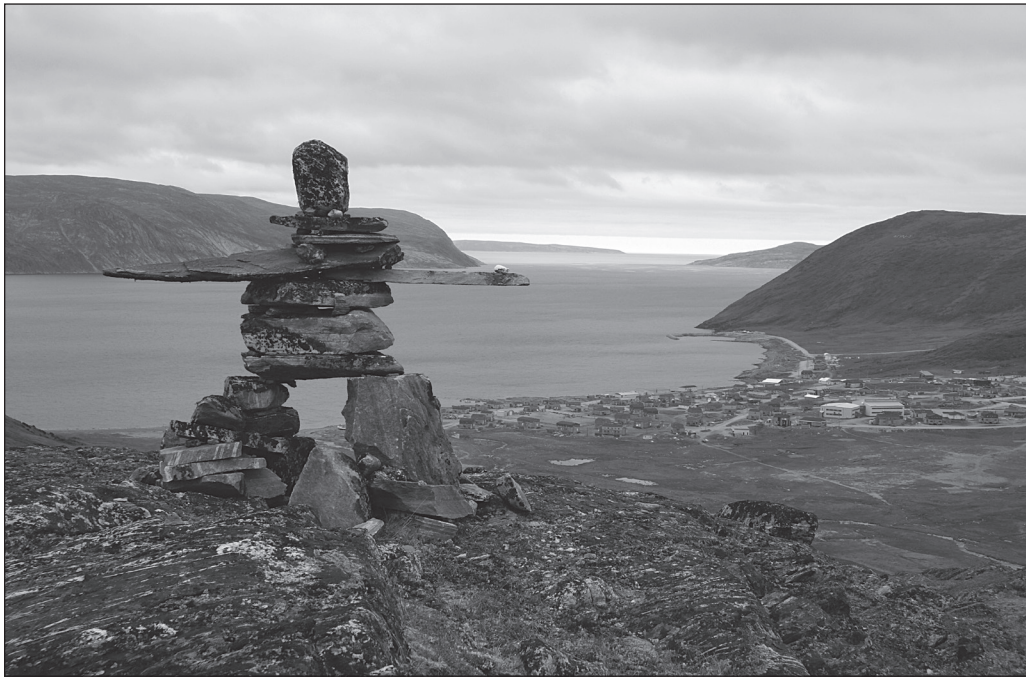
ILLUSTRATION 1 : Le petit village de Kangiqtuujaq, à proximité du cratère du Nouveau-Québec.

Parallèlement à la révision de la Loi sur les parcs (2001), alors que le nord du Québec apparaissait de moins en moins « nouveau », le gouvernement du Québec donna finalement suite à cette obligation de la CBJNQ et décida d'inscrire dans sa planification quinquennale de 2000-2004 le développement d'un immense réseau de parcs nationaux en territoire conventionné. Ce faisant, il s'engageait aussi à donner suite aux obligations de la Convention de Rio de 1992, qui avait fixé aux États signataires l'objectif de réserver 8 % de la superficie de leur territoire respectif aux fins de conservation intégrale. Le gouvernement du Québec rendit alors publique sa stratégie sur les aires protégées et annonça, à cette occasion, ses objectifs d'extension du réseau dans le Nord.