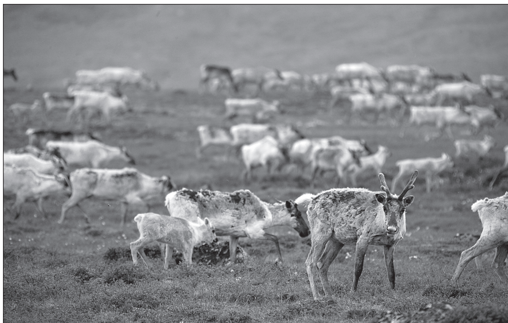
ILLUSTRATION 2 : Le parc national Kuururjuaq est un endroit décrit comme « le paradis des caribous ».

nouveaux parcs au Canada, les autorités des parcs du Nunavut ont soumis l'exemple du projet de parc de Clyde River, en soulignant que les modèles de parcs que nous connaissons ont tendance à mettre en valeur l'héritage naturel séparément de l'héritage culturel, ou à intégrer les sites patrimoniaux après avoir défini les cadres écologiques (CCP, 2012). Avec la disparition des aînés, la signification des sites pourrait être perdue pour la nouvelle génération, mais les communautés veulent encore protéger ce savoir qu'elles jugent important. L'actualisation, grâce aux parcs, de « l'esprit du lieu » devient donc une priorité.