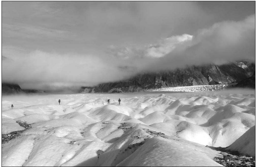
ILLUSTRATION 1 : Exploration sportive et scientifique du glacier des Exploradores au pied du Saint-Valentin (région de Aysén, Patagonie chilienne) par un groupe de guides locaux et de scientifiques franco-chiliens, reconnaissance géographique et recherche de lieux d'implantation de nouvelles stations météorologiques autonomes.

scientifique sont identifiées, définies et détaillées. Cette partie n'a pas pour prétention de référencer toutes les contributions académiques internationales utilisant la terminologie de tourisme scientifique, mais plutôt de montrer la diversité des utilisations possibles de la notion et leurs domaines d'application. La seconde partie permettra de discuter les conditions d'émergence de la notion et de sa pertinence dans les dynamiques du tourisme contemporain.