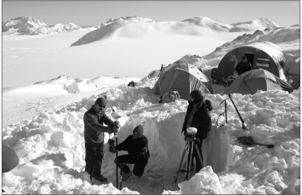
ILLUSTRATION 4 : Création d'une plateforme logistique d'observation climatologique et glaciologique sur le champ de glace continental nord de la Patagonie (région d'Aysén). Elle est destinée à accueillir des équipes scientifiques chiliennes et internationales invitées et travaillant sur des projets en lien avec les changements climatiques et les dynamiques glaciaires.

Notons qu'il existe une subtilité lexicale chez certains auteurs anglophones (Benson, 2005 ; Novelli 2005) permettant de distinguer « scientific tourism », qui correspond aux trois formes développées précédemment, et « research tourism », qui correspond à cette dernière. En allemand, la terminologie de « wissenschaftstourismus » est utilisée (Thurner, 1999).